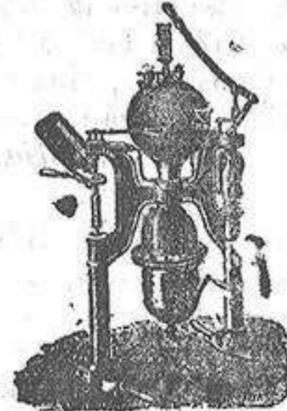
Máquina para hacer gaseosas