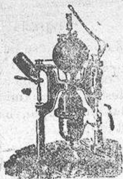
Máquina para hacer gaseosas

Máquinas de vapor, Bombas, Prensas, Tubos de todas clases.