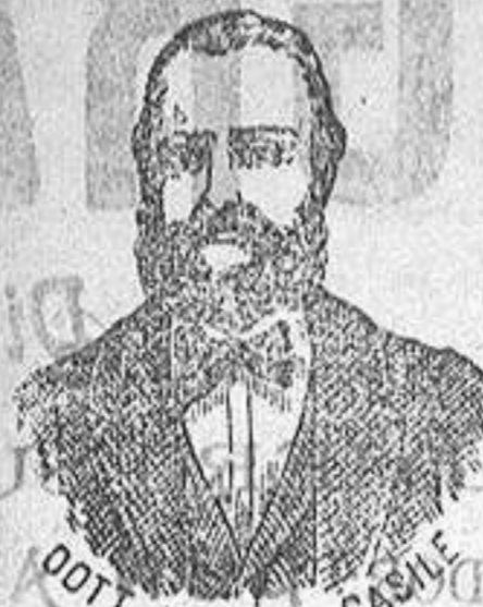
Dr. NICOLA CASILE Inventor de los renombrados medicamentos CASILE Diputación, 349. Barcelona

han logrado que el doctor Casile, descubriera los milagrosos medicamentos que curan infaliblemente la TISIS en cualquiera de sus periodos y todas las enfermedades del estómago. A la más pequeña manifestación de un RESFRIADO, TOS, CATARRO, BRONQUITIS, GRIFFE, ASMA (OPLOCACION), ESPECTORACION y de cualquier enfermedad del pecho, tomar, inmediatamente las PERLAS CASILE, que no sólo curan infaliblemente estas enfermedades, sino que se tendrá la completa seguridad de no contraer otras mucho más graves. Siguiendo este método se podrá decir NO MAS TISIS. Si por descuido no se hubiera seguido este tratamiento, y por desgracia cualquier persona se encontrara atacada de TISIS, no tiene que apurarse, que gracias a los constantes estudios, hemos podido encontrar los renombrados CONFITES CASILE, que asociados a las PERLAS combaten con eficacia la TISIS en cualquiera de sus periodos.