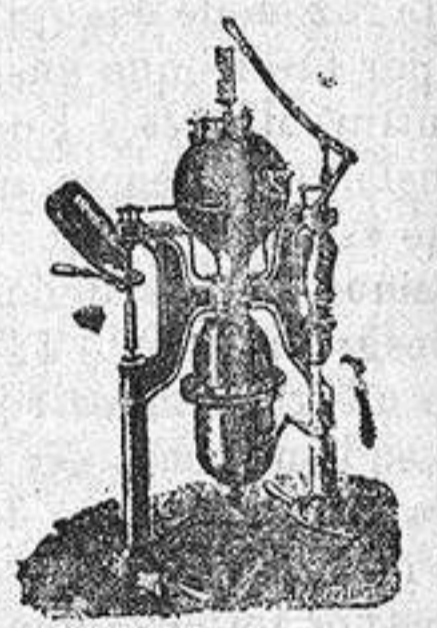
Aparatos para hacer gaseosas. Intermitente