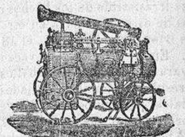
Máquina de vapor locomóvil

Catálogos gratis y franco quien los pida