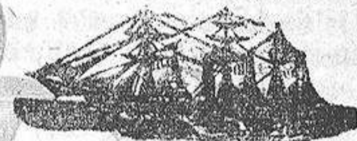
El vapor NORGE