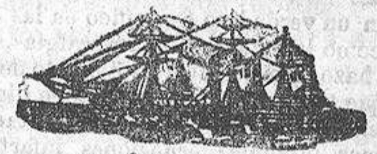
El vapor AGNES

Saldrá de este puerto para el de Rouen el 5 de Mayo; admite carga para dicho punto y Paris-Bercy.