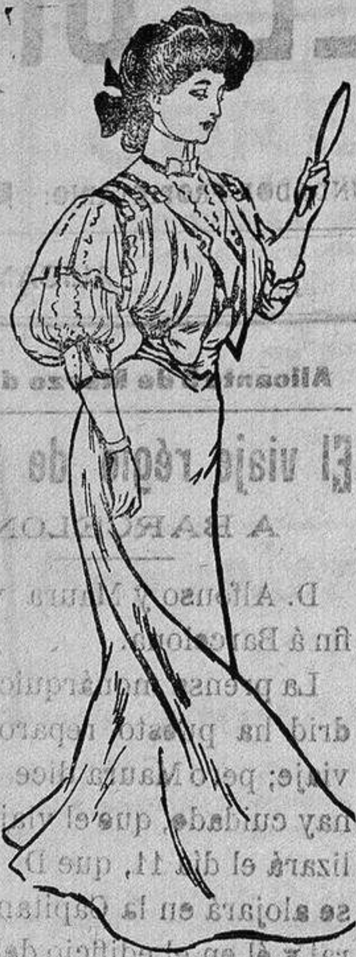
Las Pildoras Pink se hallan de venta en todas las farmacias al precio de 4 p. tas la caja ó 21 p. tas las 6 cajas.

El Ferro Quina Bisleri devuelve las fuerzas á los convalescientes.