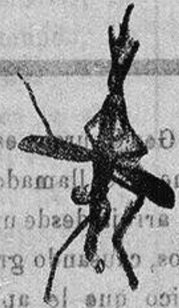
ANOFELE Mosquito que pro-duce la fiebre palúdica.