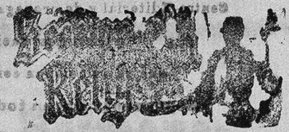
Santo de mañana: San Victorino

Así mismo en sus conocidos VIERNES Y SABADOS hay una gran sección de saldos, retales y gangas.