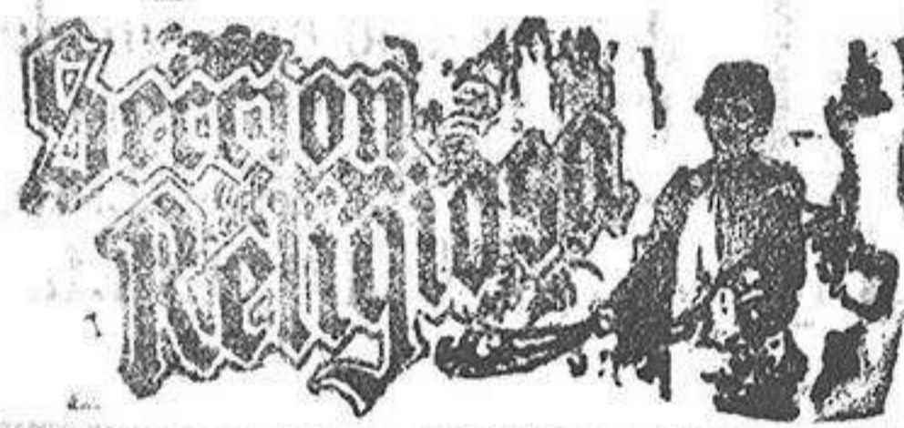
Santo de hoy: San Saverio

Para caballero hay un gran surtido en cortes de traje y pantalones, última creación, como tambien en abrigos, tanto en pieza, como confeccionados.