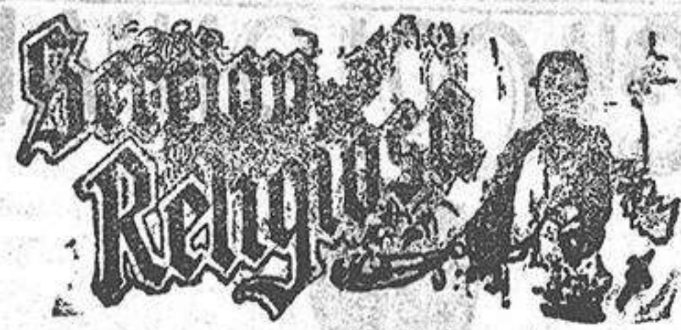
Santo de hoy: San Isidoro Santo de mañana: San Vicente

Asombroso es, en verdad, la gran liquidación que de todos los géneros de invierno, hace el conocido establecimiento de tejidos EL SIGLO, desde el 18 de Enero, por fin de temporada, y como siempre, desde este día, sus tan renombrados VIERNES y SABADOS dan principio con sus retales y saldos, casi regalados.