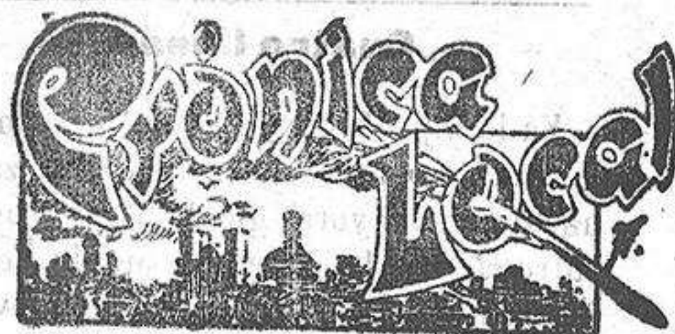
La Caja Especial de Ahorros de est

ciudad ha verificado durante la última semana, las siguientes operaciones: