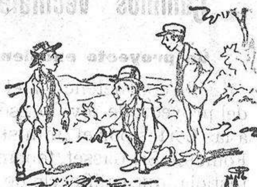
Sentaros que ya vendrán los puntos de la Algueña, Cañada, Casas de Ibá-

ñez y Eusebras, y aquí, junto al paredón, el que pasa lo copamos.