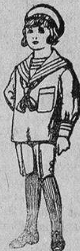
Trajes de jerga azul bordado oro en la manga para niños de 4 a 9 años De 20 a 22 ptas.

Ropas confeccionadas para Caballero, Señora, Niño y Niña