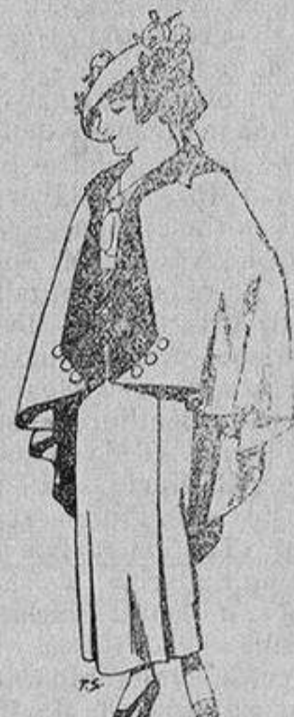
Capas de lana par jovencitas de 13 a 16 años A 25 pesetas