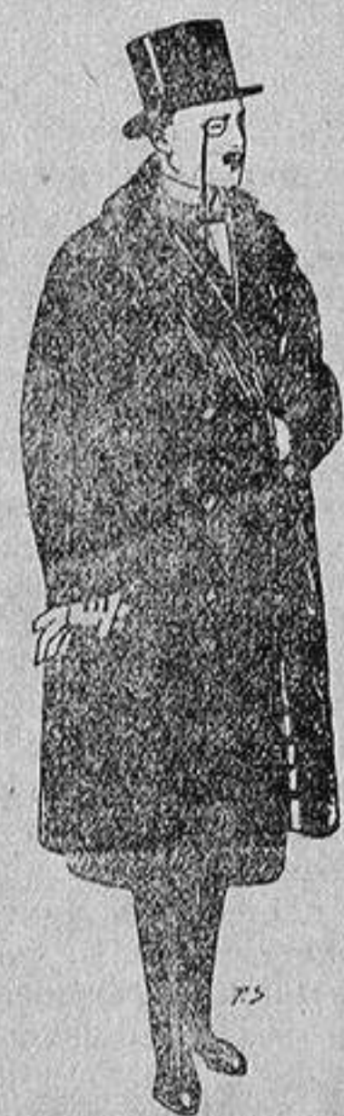
Gabanes de edredón negro, forro seda, cuello y vistas de piel a 125 ptas.