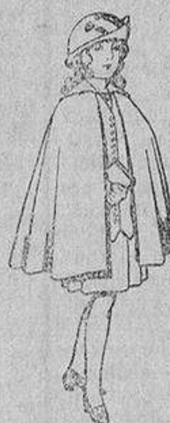
Capas de lana para niñas de 4 a 12 años De 20 a 22 ptas.

SECCIONES: Peletería, Camisería, Gé-neros de Punto, Corbatería, Guante-ría, Sombrerería, Zapatería, Paraguas, Bastones y Artículos de Viaje.