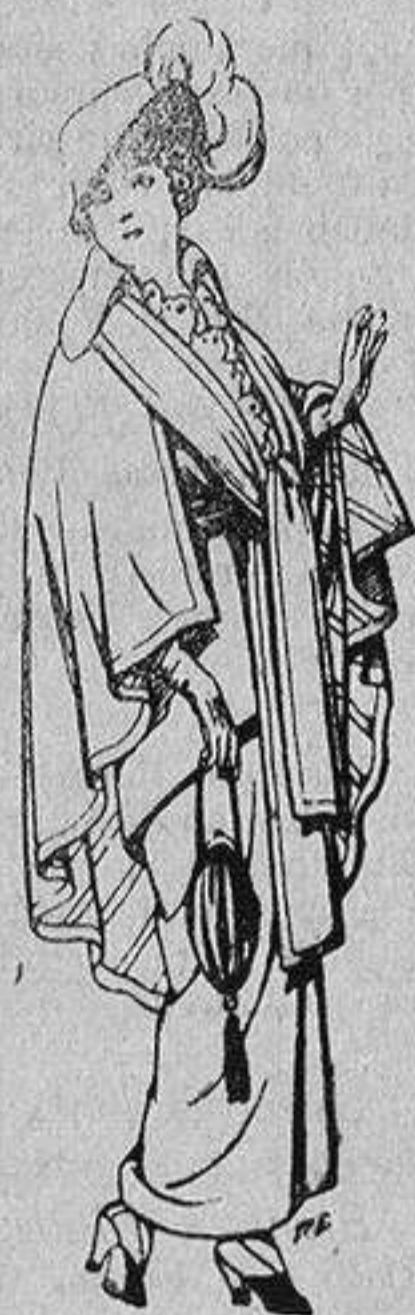
Capas de lana para señora A 20 ptas.