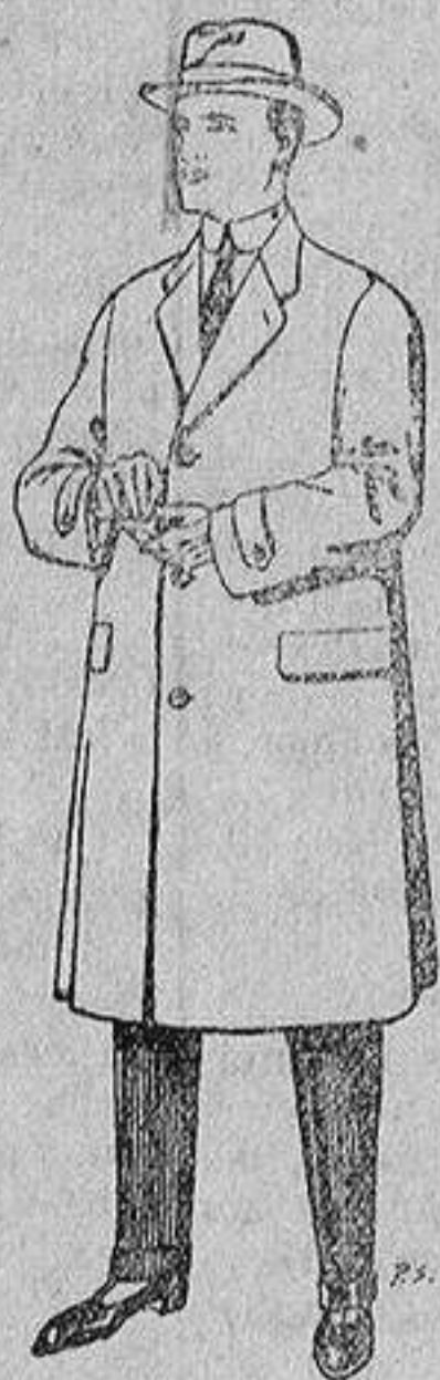
Gabanes de tejidos pluma satina, etc. De 17'50 a 70 ptas.