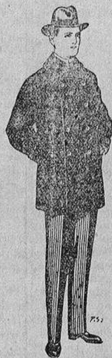
Pellizas con cuello y bocamangas de astrakan De 11' a 40 ptas