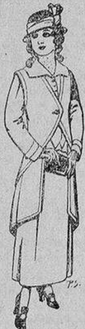
Trajes de lanilla para jovencitas de 13 a 16 años De 40 a 45'ptas.