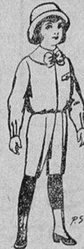
Trajes patén para niños de 4 a 9 años De 5 a 5'50 ptas.