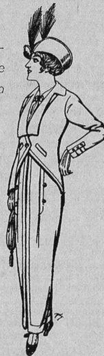
Trajes de rga negra para Señora 65 ptas.