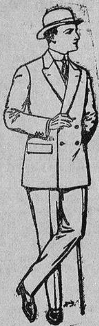
Trajes de cheviot, patén, etc. De 25 a 80 ptas.

Madrid, Barcelona, Alicante, Almería, Bilbao, Gá-diz, Cartagena, Gijón, Granada, Málaga, Palma de Mallorca, Santander, Sevilla, Valencia, Valladolid y Zaragoza