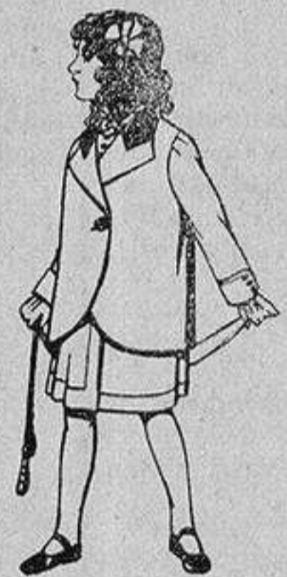
Trajes de lanilla para niños de 4 a 12 años De 14 a 22 ptas.