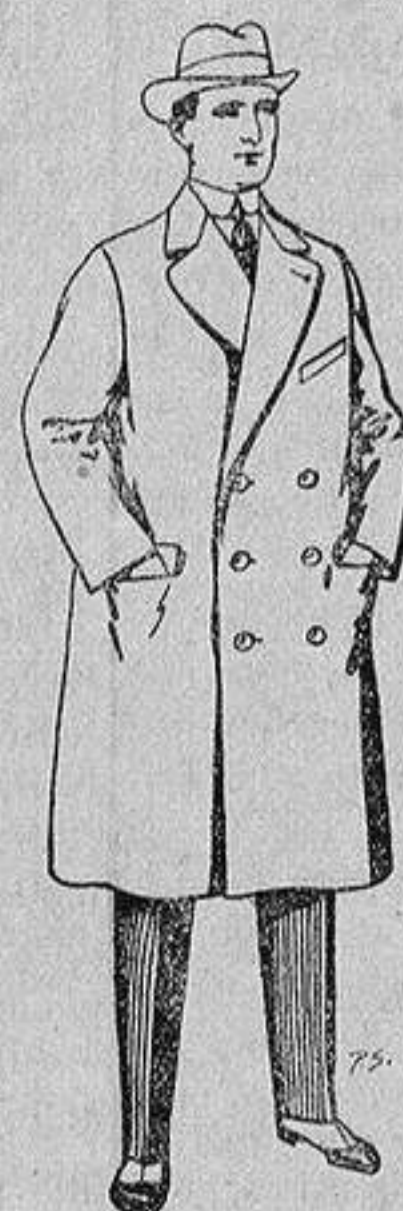
Gabanes de patén y cheviot 55 a 105 ptas.