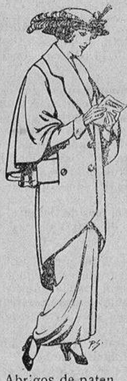
Abrigos de patén para Señora De 55 a 65 ptas.