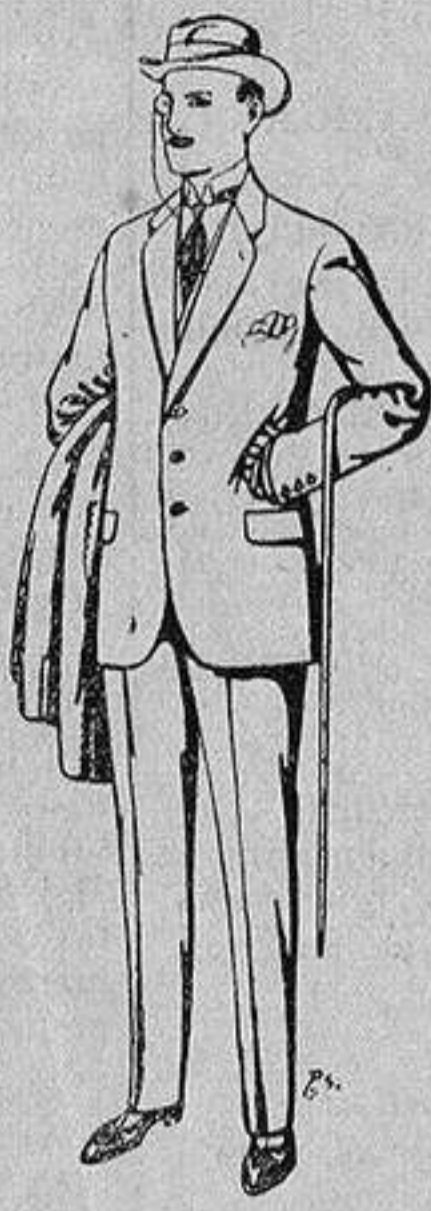
Trajes de patén, cheviot, etc. De 17'50 a 70 ptas.