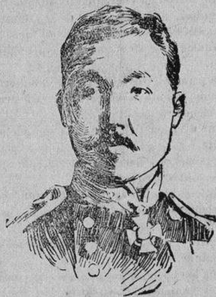
EL ALMIRANTE KUROKI comandante de la escuadra japonesa que bombardea la colonia alemana de Kiau-Chia