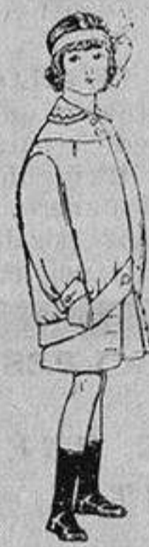
Trajes de lanilla para niños de 4 a 12 años De Ptas. 20 a 30