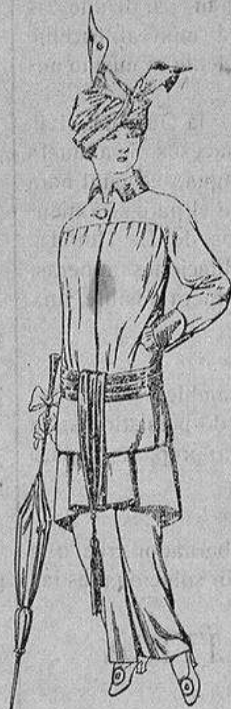
Traje de jerga azul o negra y géneros novedad, para señora De Ptas. 65 a 80