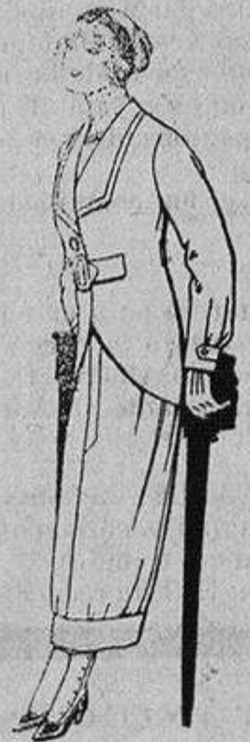
Trajes de lanilla para jovencitas de 13 a 16 años A Ptas. 27