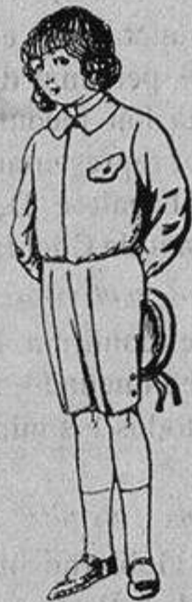
Trajes de lanilla, vicuña o jerga, para niños de 4 a 9 años De Ptas. 5 a 10