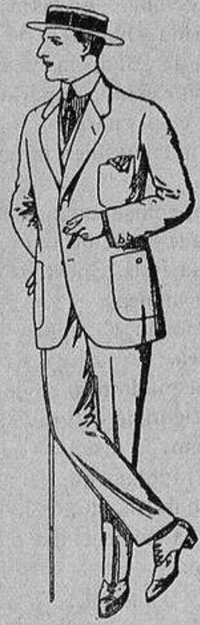
Trajes de dril crudo kaki o listado De Ptas. 10 a 32

Madrid, Barcelona, Alicante, Almería, Bilbao, Cádiz, Cartagena, Gijón, Granada, Málaga, Palma de Mallorca, Santander, - Sevilla, Valencia, Valladolid y Zaragoza -