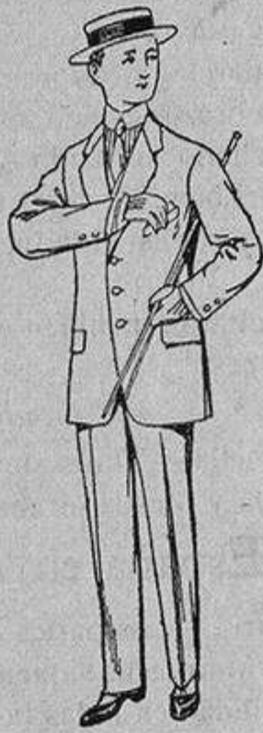
Trajes de nanilla vicuña, etc., para niños de 10 a 15 años De Ptas. 14 a 48