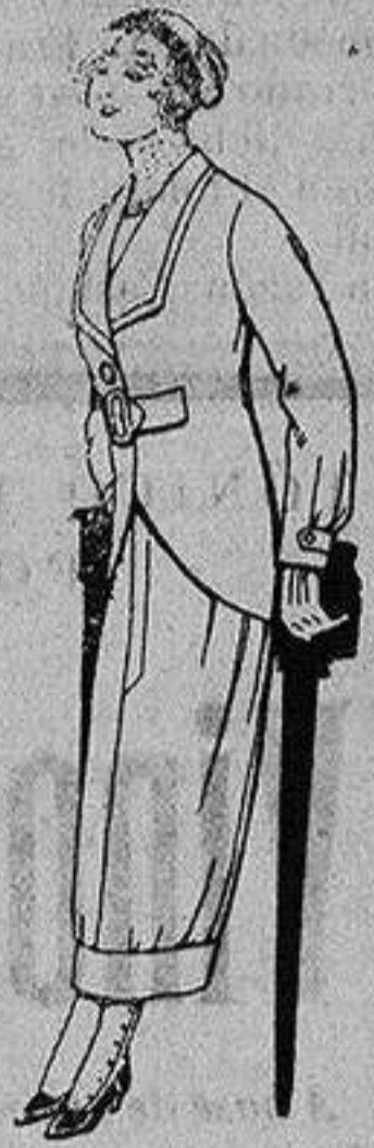
Trajes de lanilla para jovencitas de 13 a 16 años. A Ptas. 27