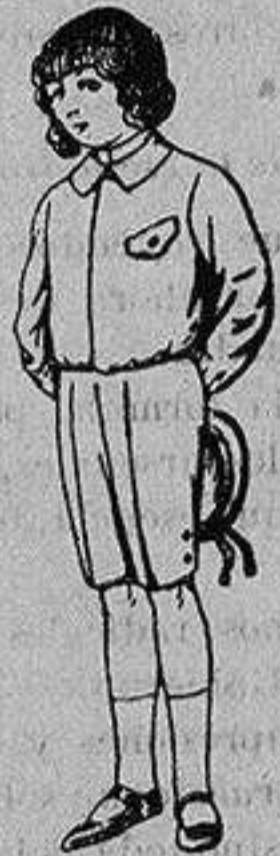
Trajes de lanilla, vicuña o jerga, para niños de 4 a 9 años. De Ptas. 5 a 10

Ropas confeccionadas para Caballero, Señora, Niño y Niña