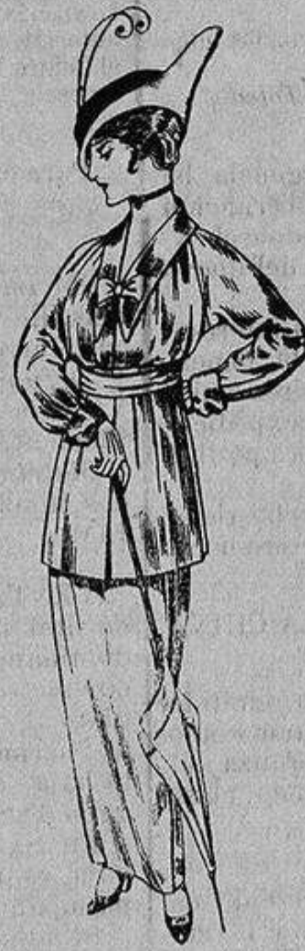
Vestido de lana negra o azul para señora. De Ptas. 35 a 40