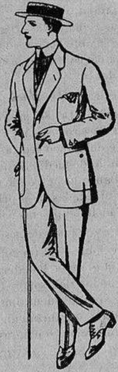
Trajes de dril crudo kaki o listado. De Ptas. 10 a 32

Madrid, Barcelona, Alicante, Almería, Bilbao, Cádiz, Cartagena, Gijón, Granada, Málaga, Palma de Mallorca, Santander, - Sevilla, Valencia, Valladolid y Zaragoza -