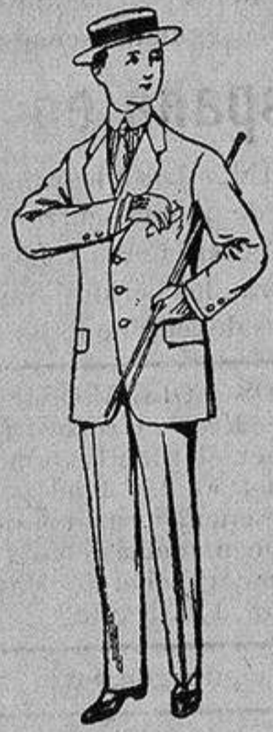
Trajes de nanilla vicuña, etc., para niños de 10 a 15 años. De Ptas. 14 a 48