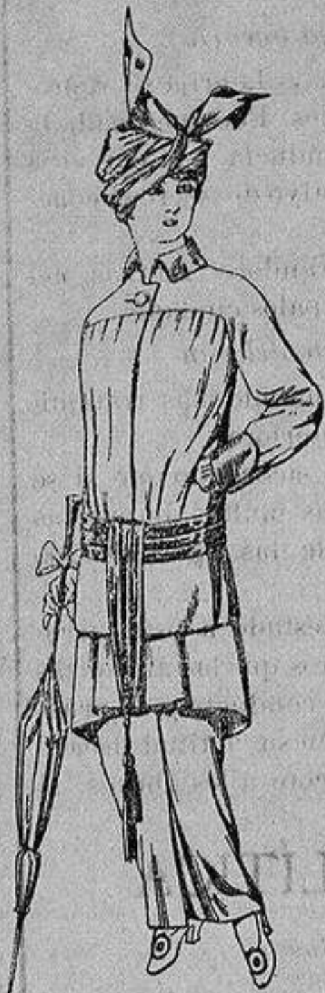
Traje de jerga azul o negra y géneros novedad, para señora. De Ptas. 65 a 80