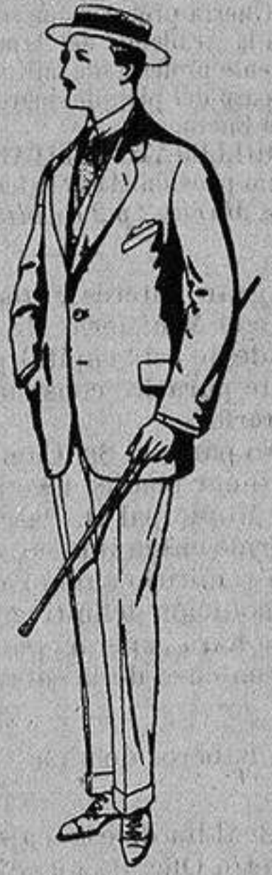
Trajes de alpaca uagra. De Ptas. 32 a 56