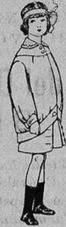
Trajes de lanilla para niños de 4 a 12 años. De Ptas. 20 a 30

PRECIO FIJO y VENTAS AL CONTADO. PIDASE EL CATALOGO GENERAL.