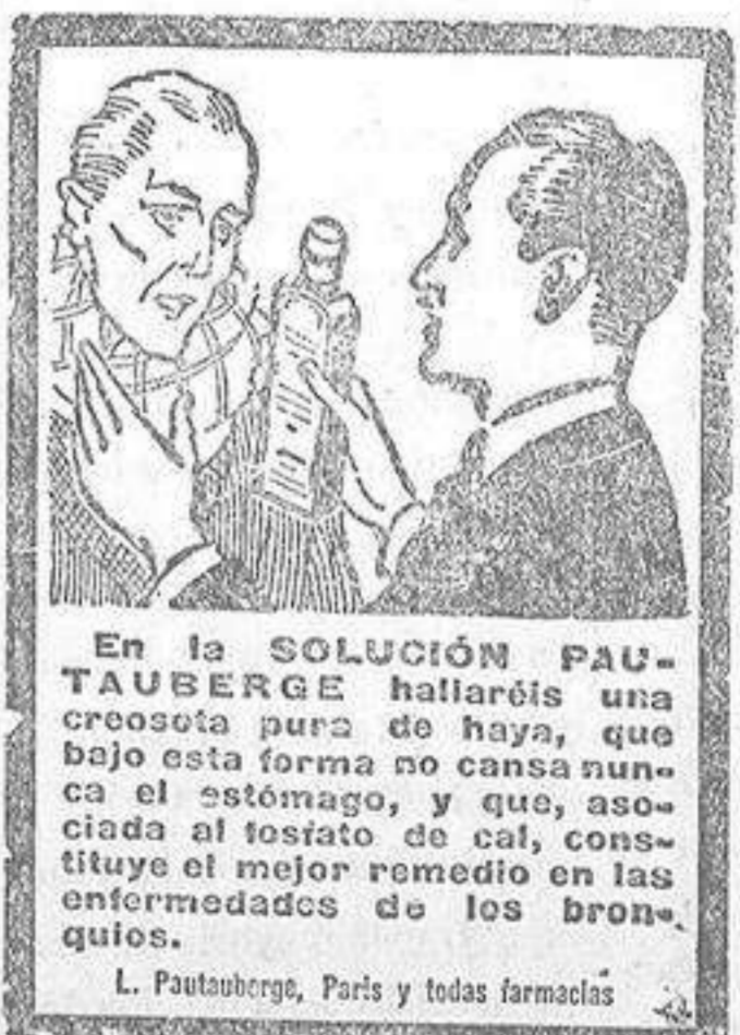
En la SOLUCIÓN PAUTAUBERGE hallarás una creosota pura de haya, que bajo esta forma no cansa nunca el estómago, y que, asociada al fosfato de cal, constituye el mejor remedio en las enfermedades de los bronquios. L. Pautauberge, París y todas farmacias

Capeltint el verdugo de las canas Los fogueres a la Bellea del Foc Mañana a las dos de la tarde, en el Restaurant Alhambra, ofrecen las Comisiones de Fogueres un banquete a la Bellea del Foc y sus Doncellas de Honor, como homenaje de simpatía y acatamiento. Las tarjetas, al precio de Ptas. 10,50 se expenden en el mismo restaurant siendo su número limitado, puesto que se ha querido dar caracter puramente fogueril al acto.