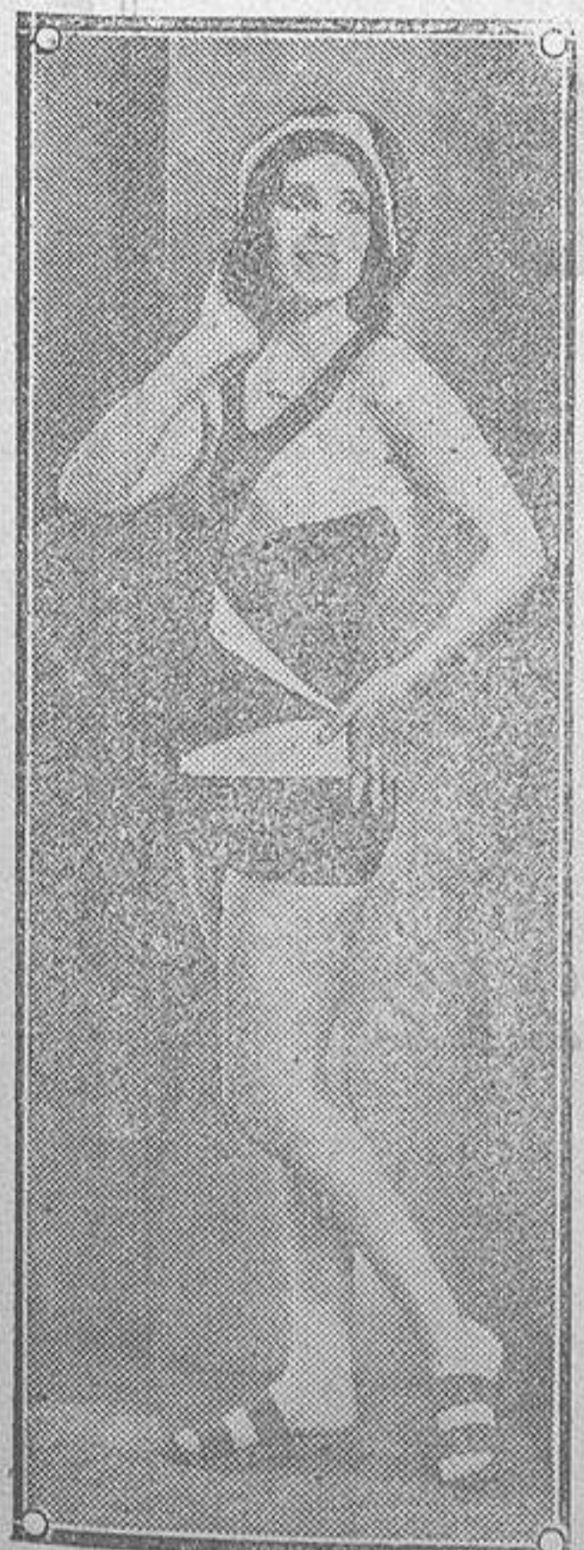
Raquel Torres de la Metro Goldwyn Mayer