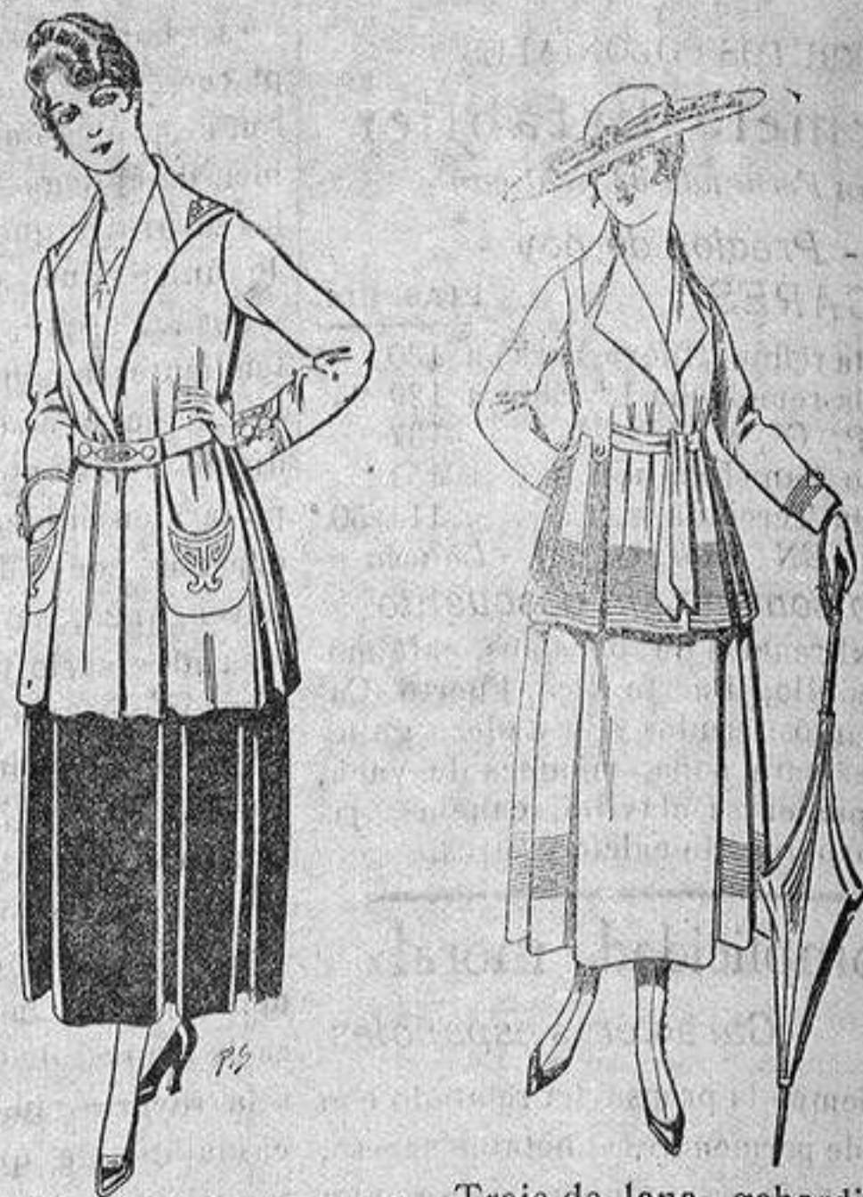
Paletot de tricot de seda o lana. De ptas. 14 a 57. Traje de lana, gabardina negra, azul y color, diferentes bordados. De ptas. 8'50 a 90.