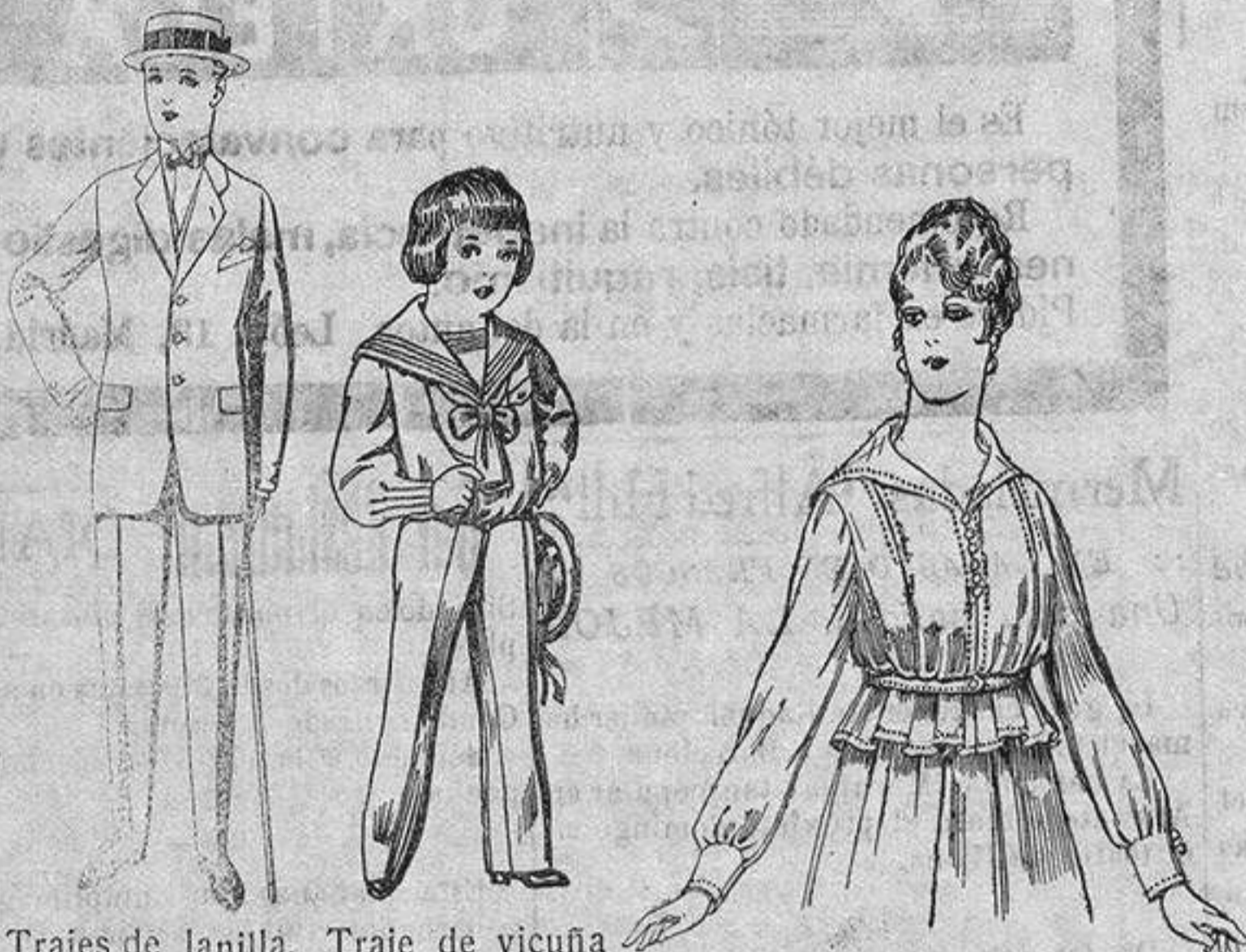
Trajes de lanilla, vicuña, etc. para jovencitos de 10 a 17 años. De ptas. 17 a 50. Traje de vicuña ó jerga azul y negra, para niños de 4 a 9 años. De ptas. 7'50 a 22. Blusa voile en blanco y negro. De ptas. 5'56 a 7.

Ropas confeccionadas para Caballero Señora, Niño y Niña