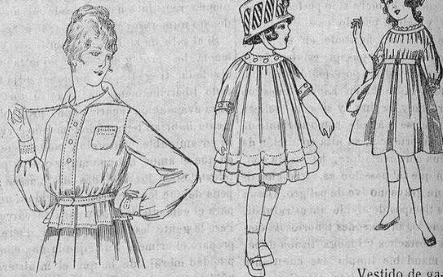
Blusa batista blanca, cuello con calados. A ptas. 4'50. Vestidos de voile blanco, con bordados. De ptas. 7 a 10. Vestido de gabardina blanca, azul y colores. De ptas. 18 a 25.

Gamisería, Géneros de Punto, Corbatería, Guantería, Sombrerería, Zapatería, Bastones, Paraguas y Artículos de Viaje