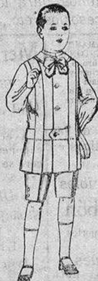
Traje de lanilla, para niños de 4 a 9 años. de ptas. 12 a 31