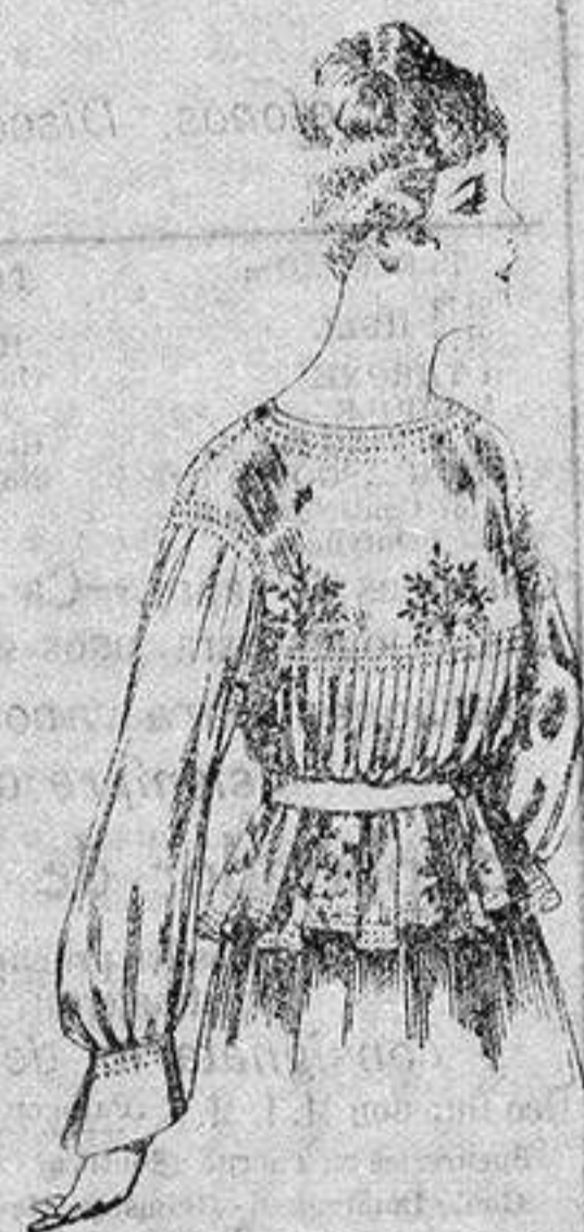
Blusa de crespón o seda, en negro, azul y color. de ptas. 33 a 35

Ropas confeccionadas para Caballero, Señora, Niño y Niña