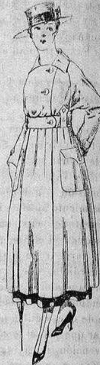
Guardapolvo de dril beige manga Ragland. a ptas. 23