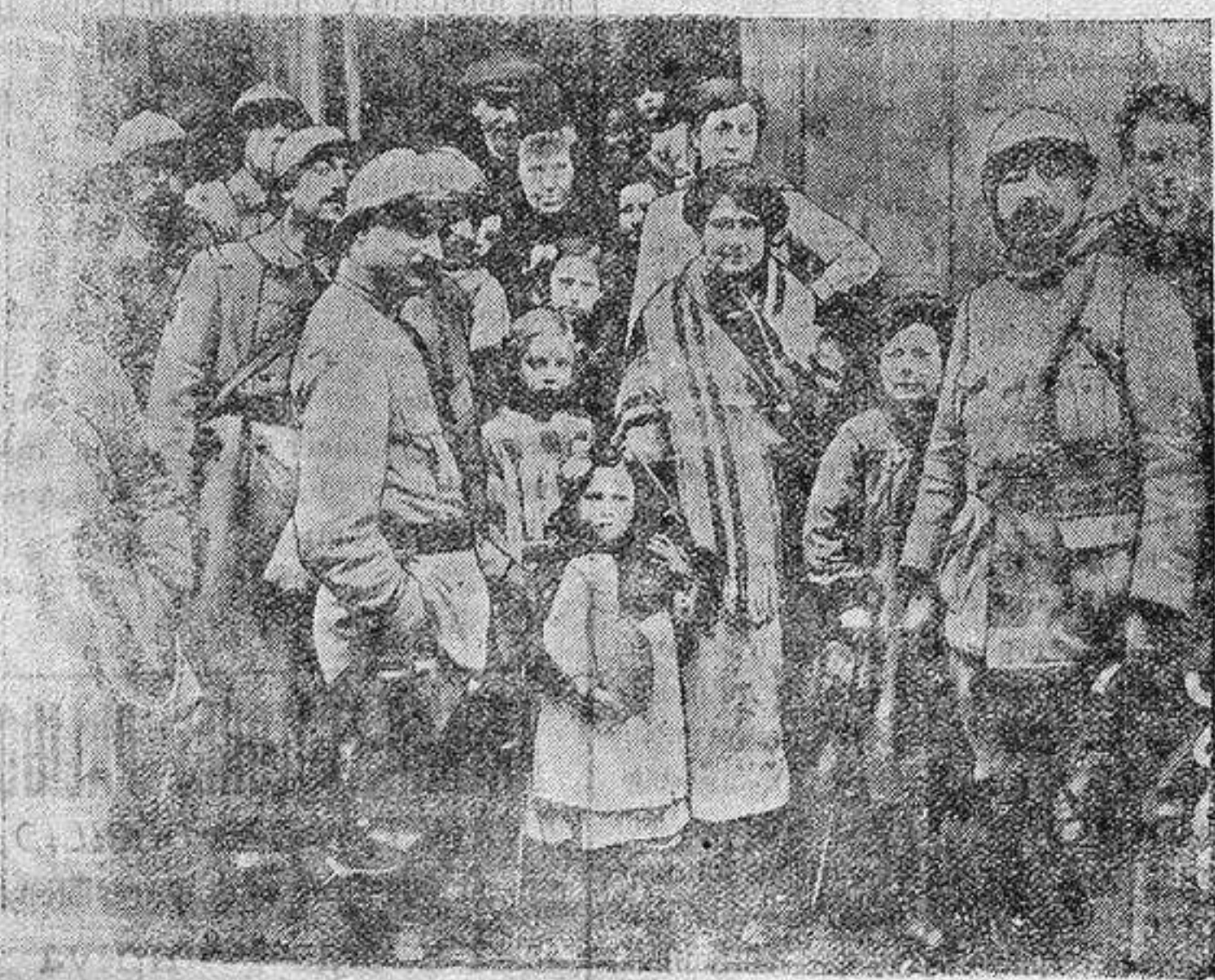
La administración principal francesa distribuyendo pan a los habitantes de Roye