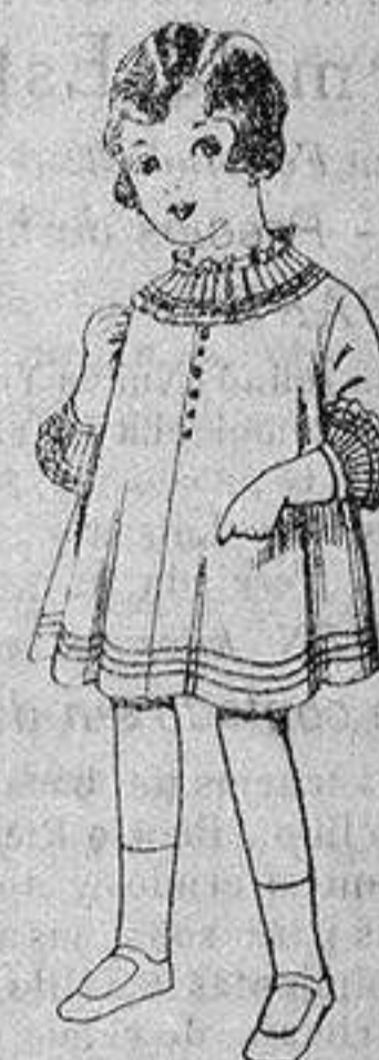
Vestido de voile blanco bordado. De ptas. 6'75 a 8