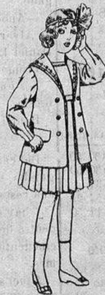
Traje de gabardina blanco, cuello de organdín bordado, para niñas de 4 a 9 años. De ptas. 22 a 24