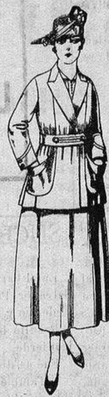
Traje de estambre negro, azul y color. de ptas. 70 a 75