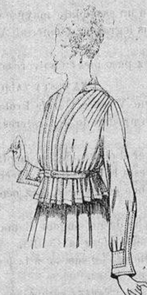
Blusa batista blanca A ptas. 5'75

Gamisería, Géneros de Punto, Corbatería, Guantería, Sombrerería, Zapatería, Bastones, Paraguas y Artículos de Viaje