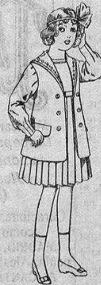
Traje de gabardina blanco, cuello de organdín bordado, para niñas de 4 a 9 años. De ptas. 22 a 24