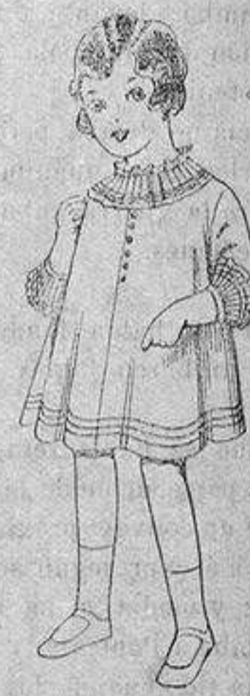
Vestido de voile blanco bordado. De ptas. 6'75 a 8