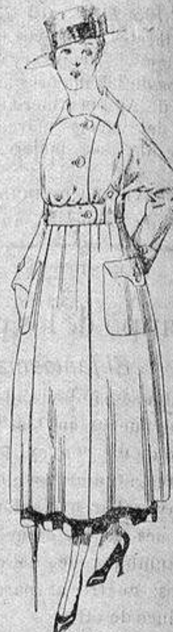
Guardapolvo de dril beige manga Ragland. a ptas. 23