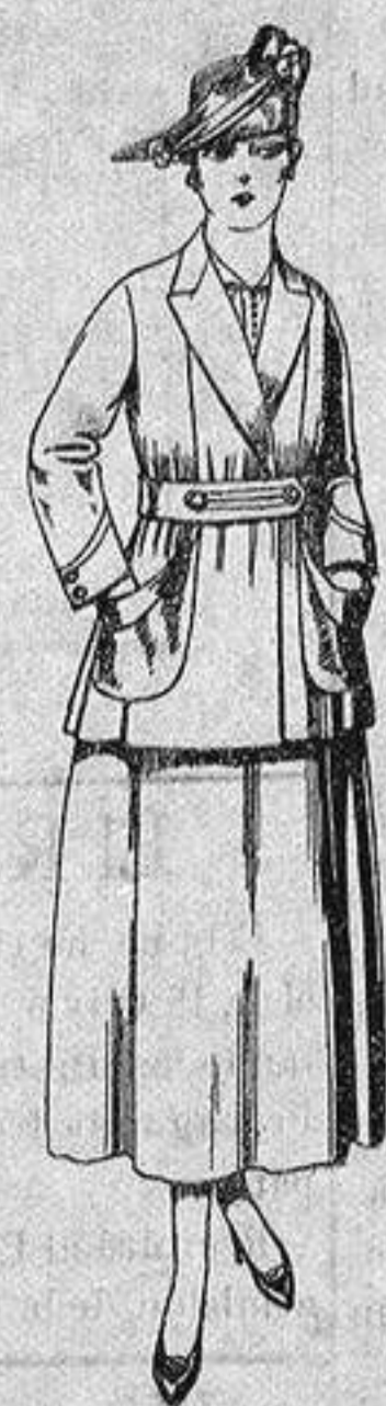
Traje de estambre negro, azul y color. de ptas. 70 a 75