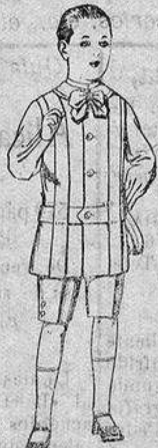
Traje de lanilla, para niños de 4 a 9 años. de ptas. 12 a 31