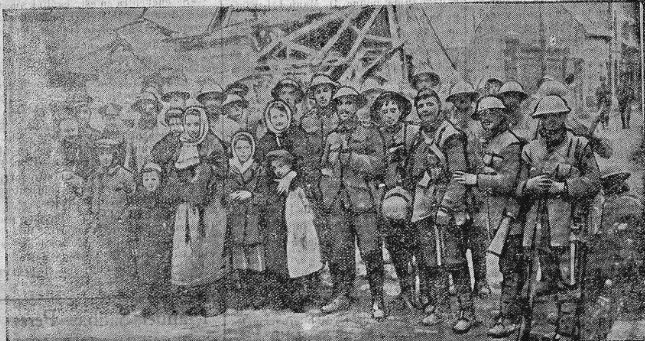
CIUDADANOS DE NESLE REGIENDO A LAS TROPAS FRANCESAS