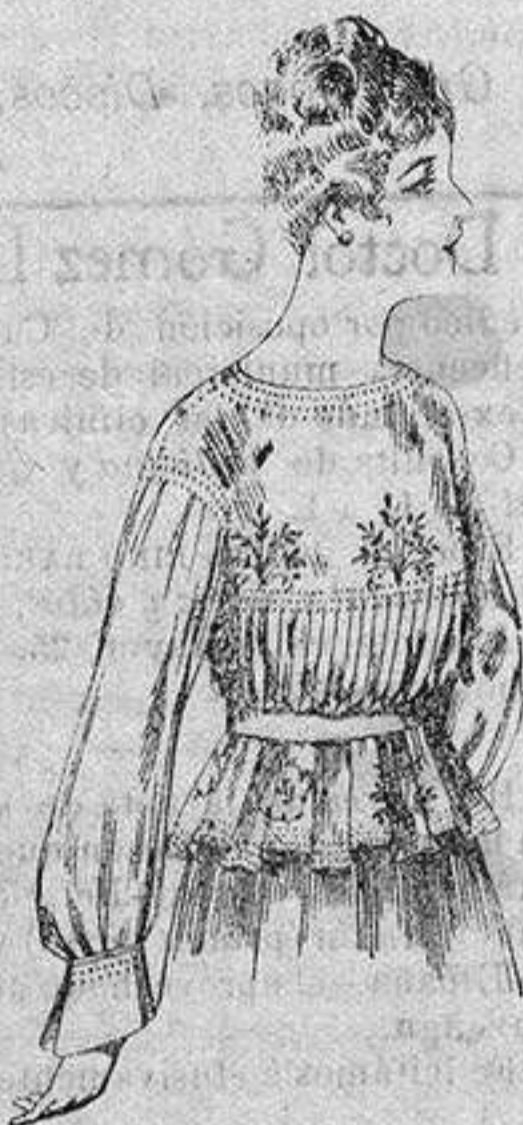
Blusa de crespón o seda, en negro, azul y color. de ptas. 33 a 35

Ropas confeccionadas para Caballero Señora, Niño y Niña