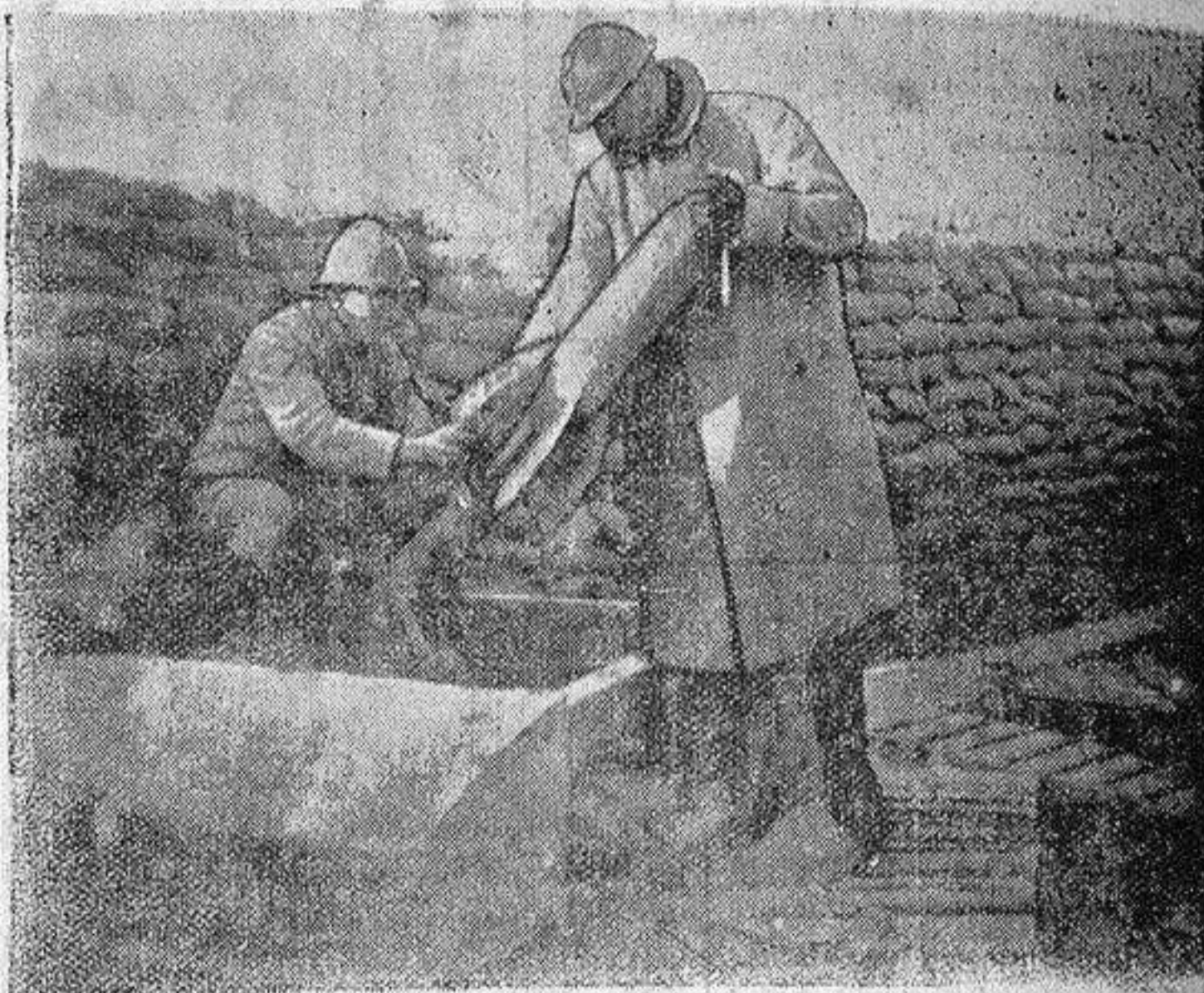
DISPARANDO UN TORIEDO AÉREC