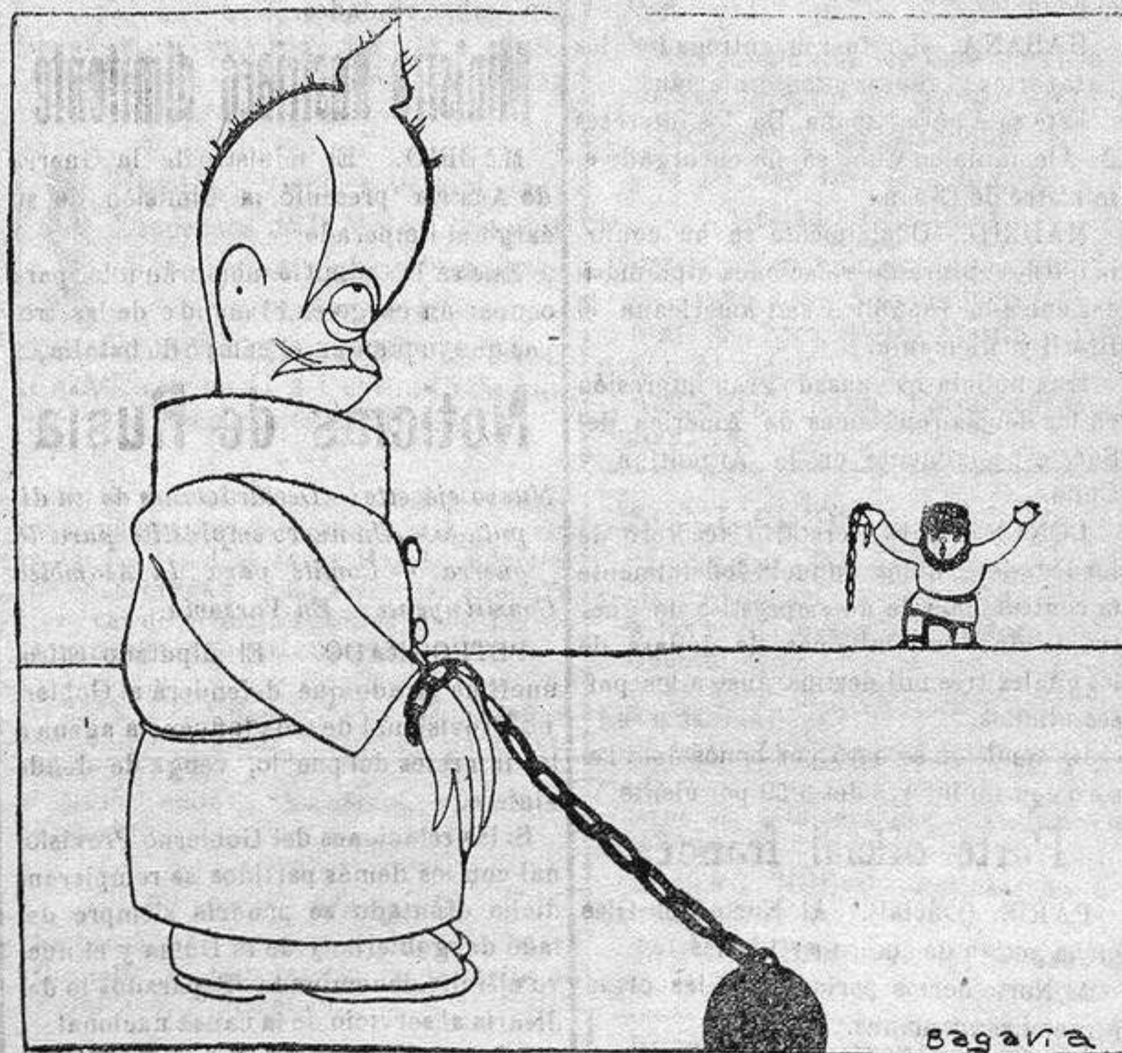
¡¡AY, SI YO SUPIERA!!