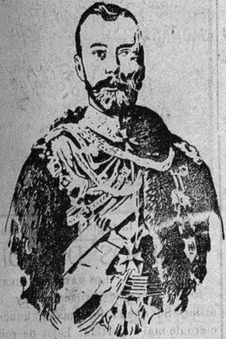
Nicolás II de Rusia

El primer acto realizado por Nicolás II al ocupar el trono, fué dirigir una mani-