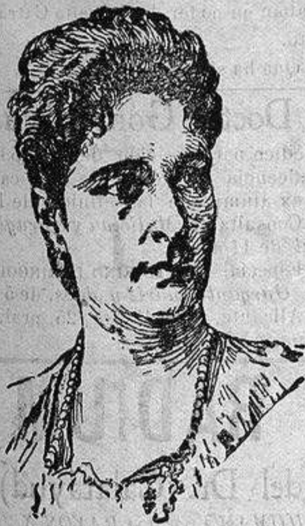
La ex-zarina Alejandra de Rusia

En el mismo año de la coronación, y cuando los Emperadores de Rusia prepa-