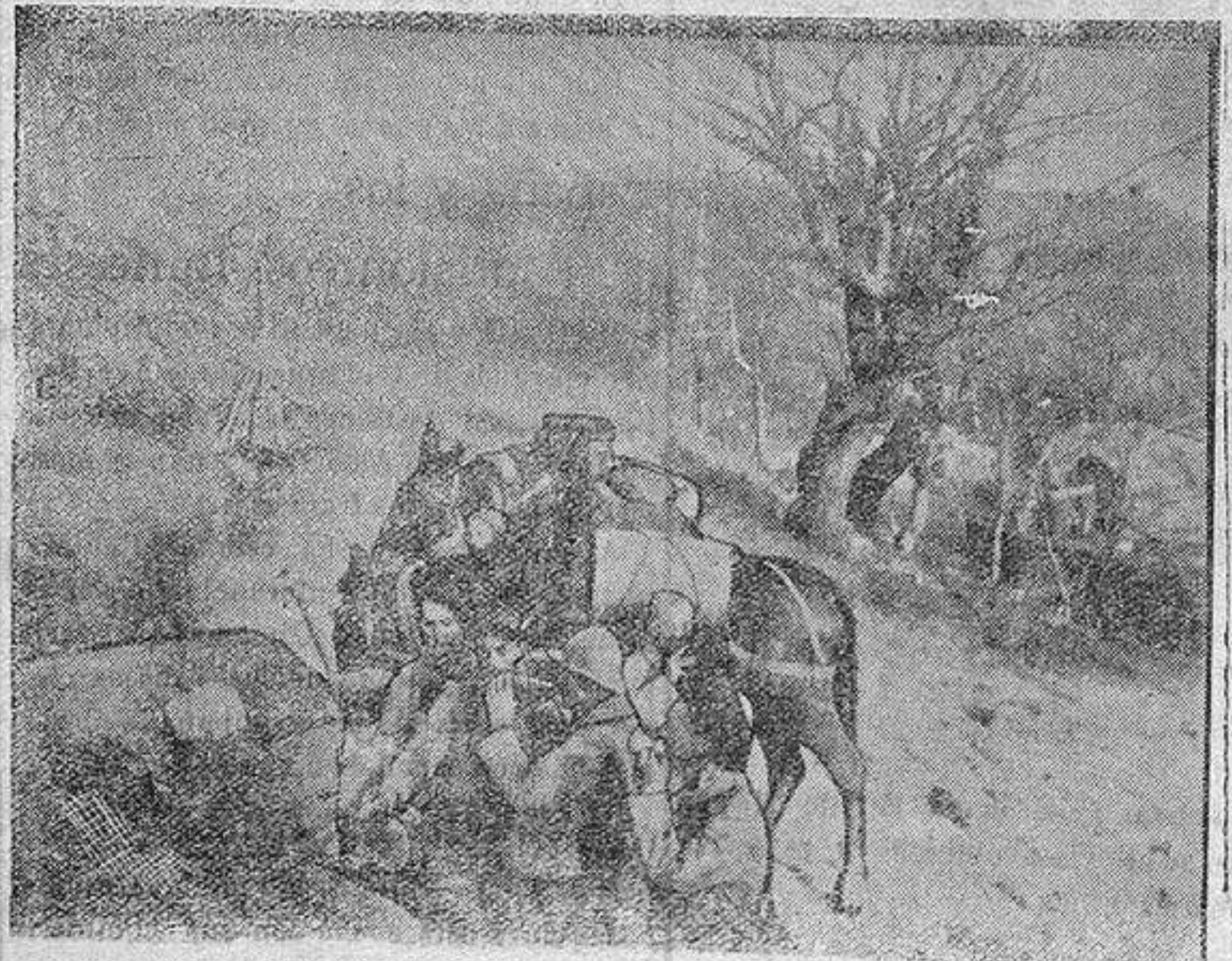
EN UNA FUENTE