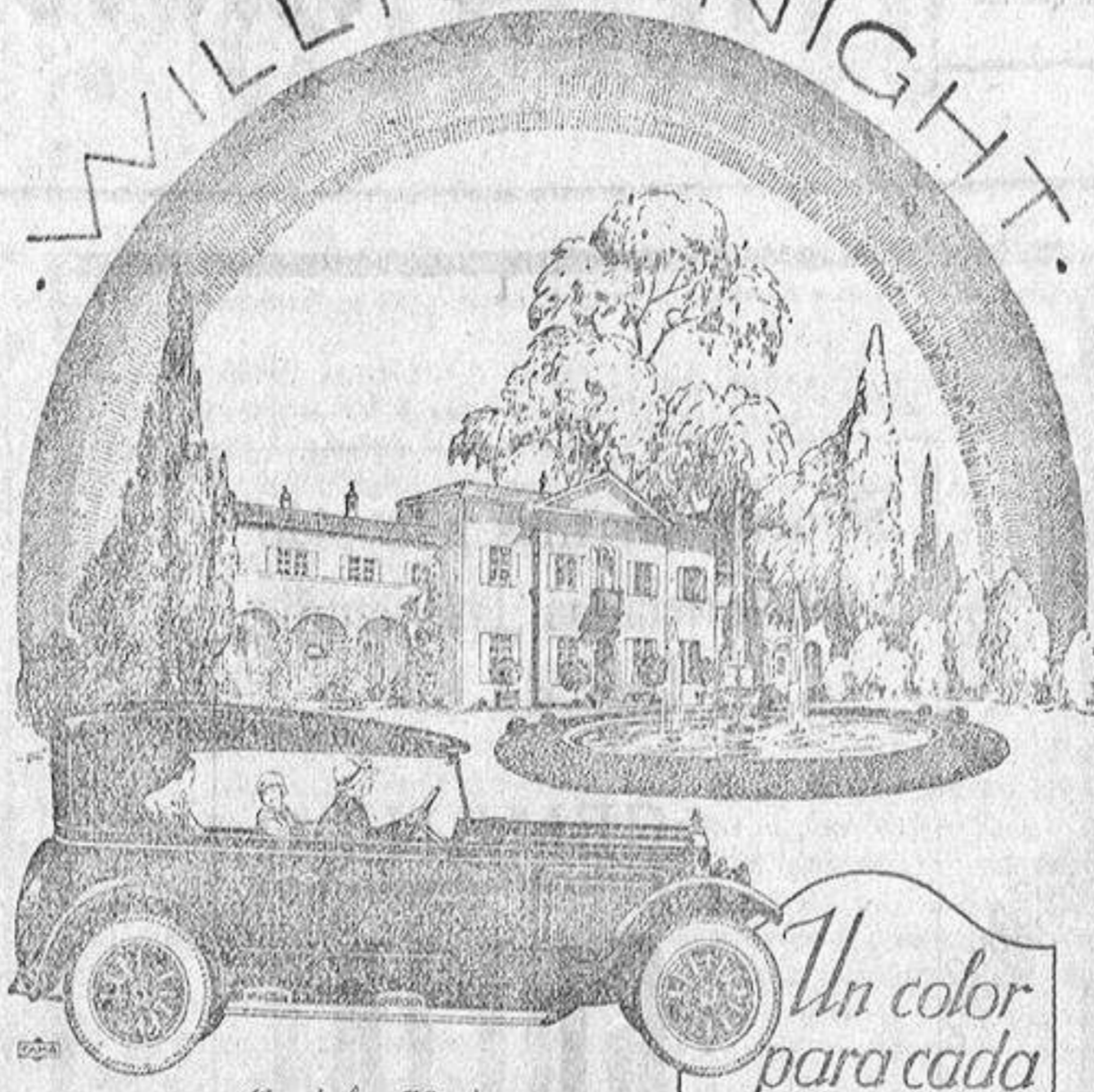
Modelo 70 de 2600 de cilindrada

Un color para cada gusto y para todos los gustos un magnifico