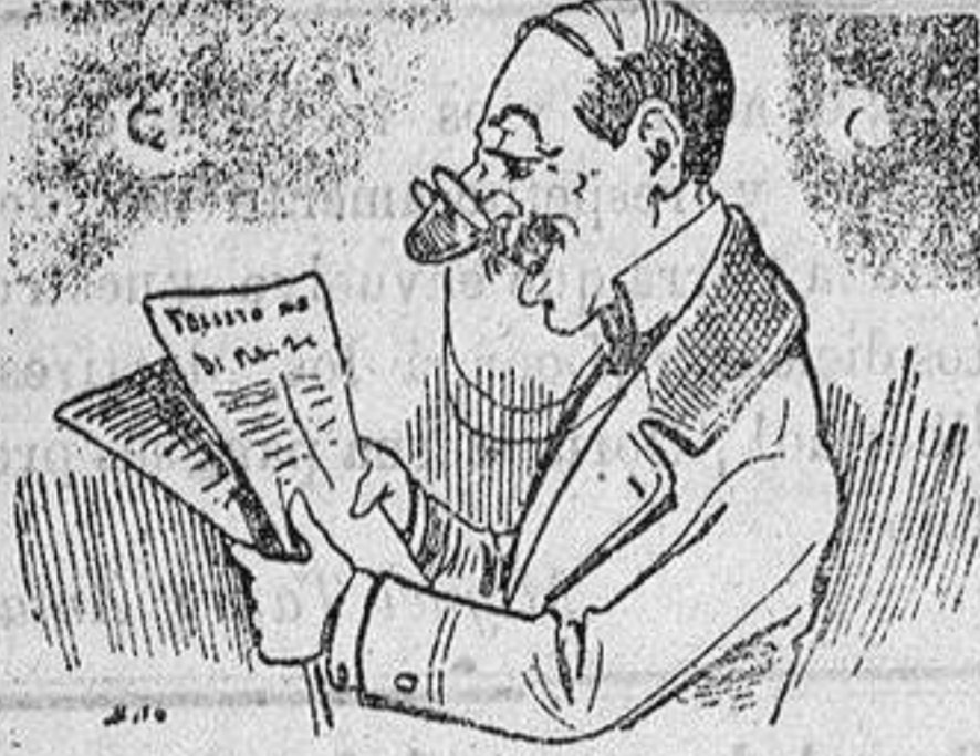
Denia 8, 12 m.

Hé aquí los telegramas que recibimos, leemos y transmitimos al público: