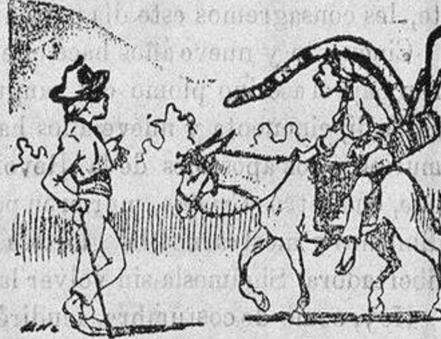
Orihuela-Dolores 8, 6 n.

Es muy posible que se retire de la lucha.