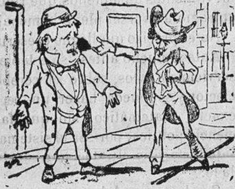
Villajoyosa-Jijona 8, 10 m.