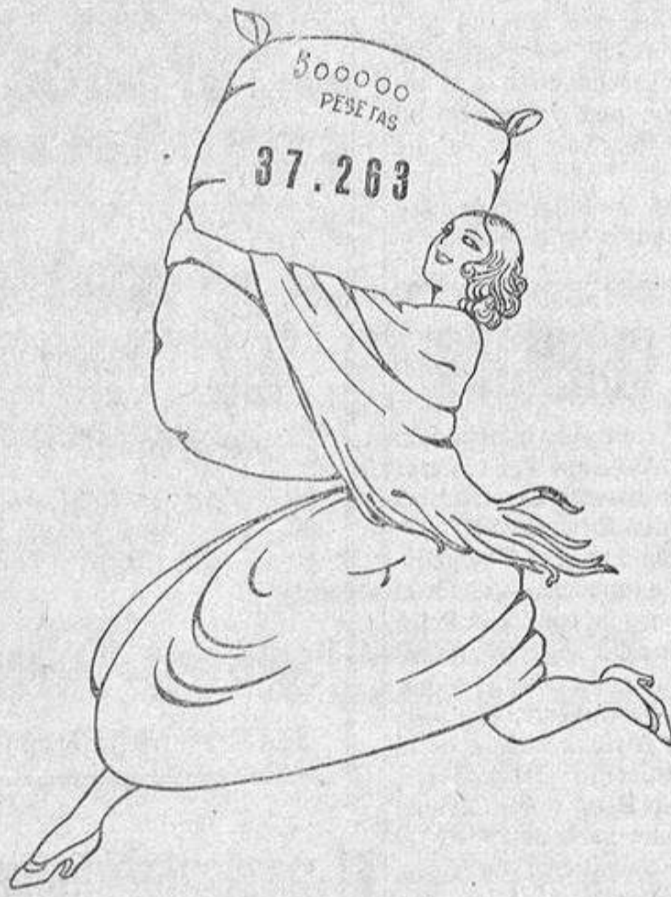
Dibujo de G. Stón Costello

NUMEROS PREMIADOS EN EL SORTEO DE HOY, TOMADOS AL OIDO Y TRASMITIDOS POR TELEGRAFO