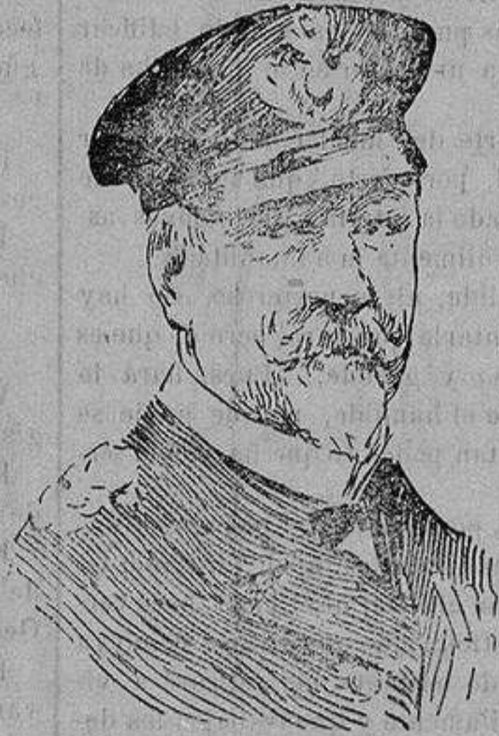
El Almirante SCHREUDER, jefe de las fuerzas sutiles alemanas que tienen sus bases en las costas de Bélgica.