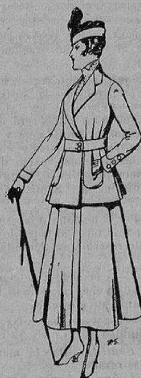
Trajes de lana negra azul y color, para señora De ptas. 50 a 55