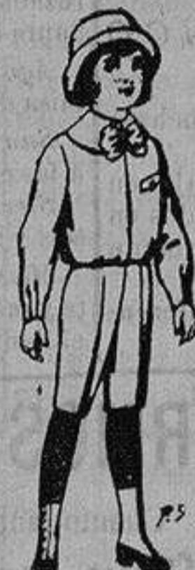
Trajes de patén para niños de 4 a 9 años De ptas. 5 a 7'50