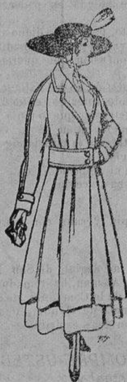
Abrigos de patén gran novedad para señora A ptas. 58