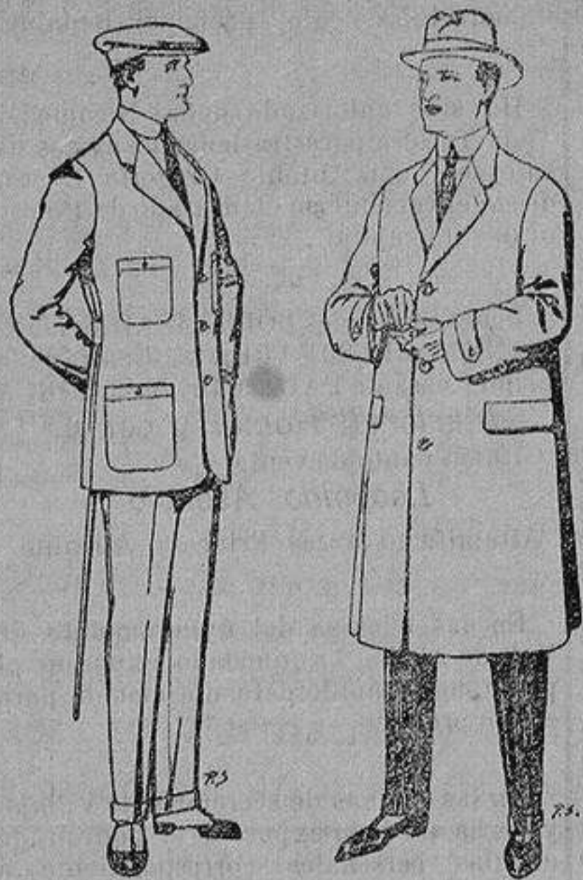
Trajes de cheviot corte elegante para «Sportman» De 35 a 50 ptas.

Peletería, Camisería, Generos de Punto, Corbatería, Guantería, Sombrerería, Zapatería, Paraguas, Bastones y Artículos de Viaje.