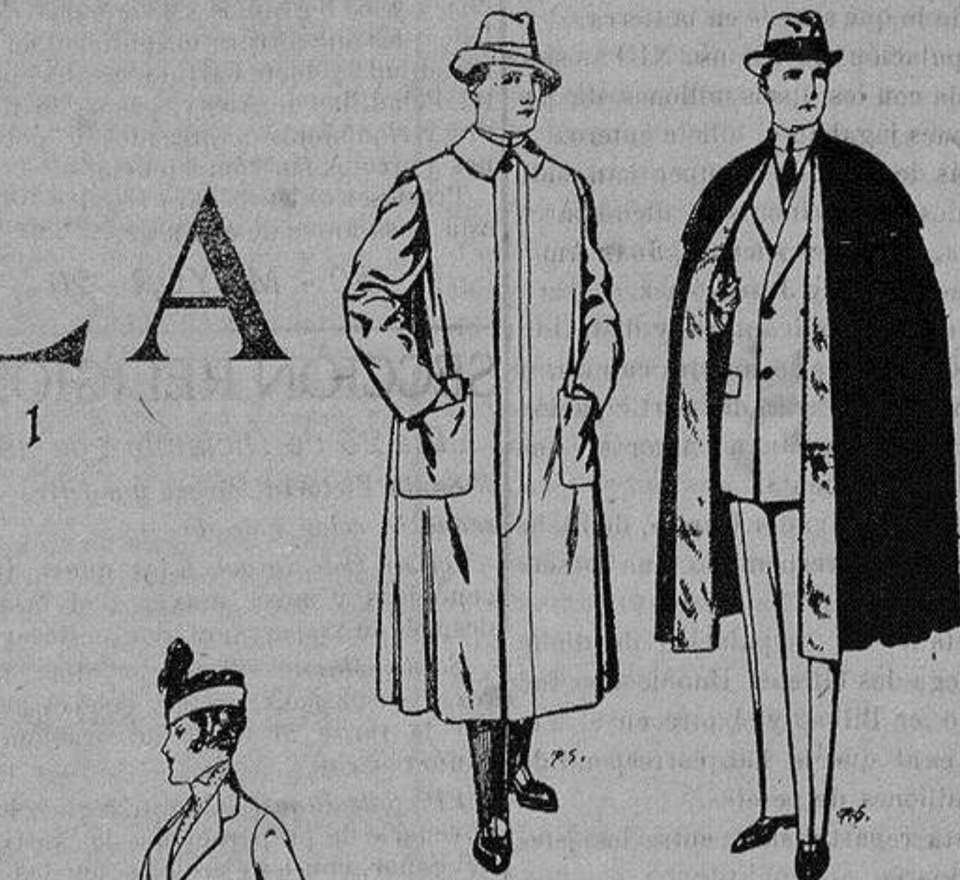
Impermeables forma gabán en color beige o gris De ptas. 35 a 100