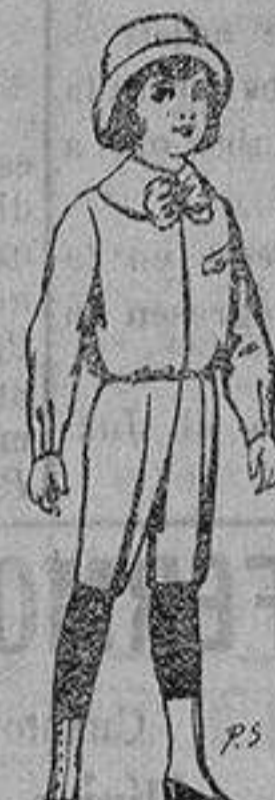
Trajes de patén para niños de 4 a 9 años De ptas. 5 a 7'50