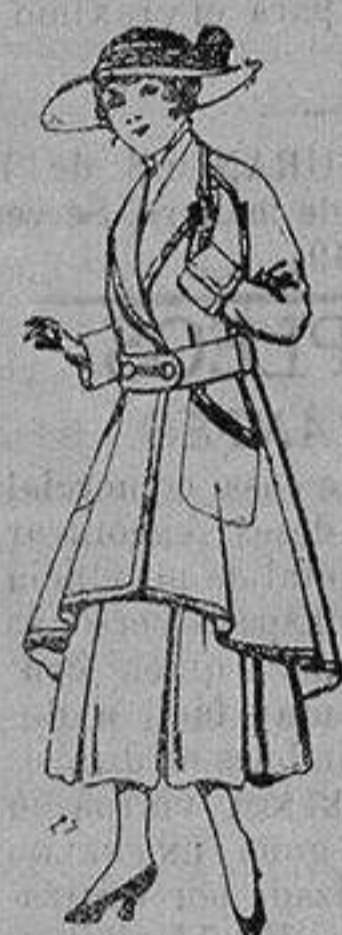
Abrigos de patén para jovencitas de 13 a 16 años De ptas. 25 a 35

Ropas confeccionadas para Caballero, Señora, Niño y Niña