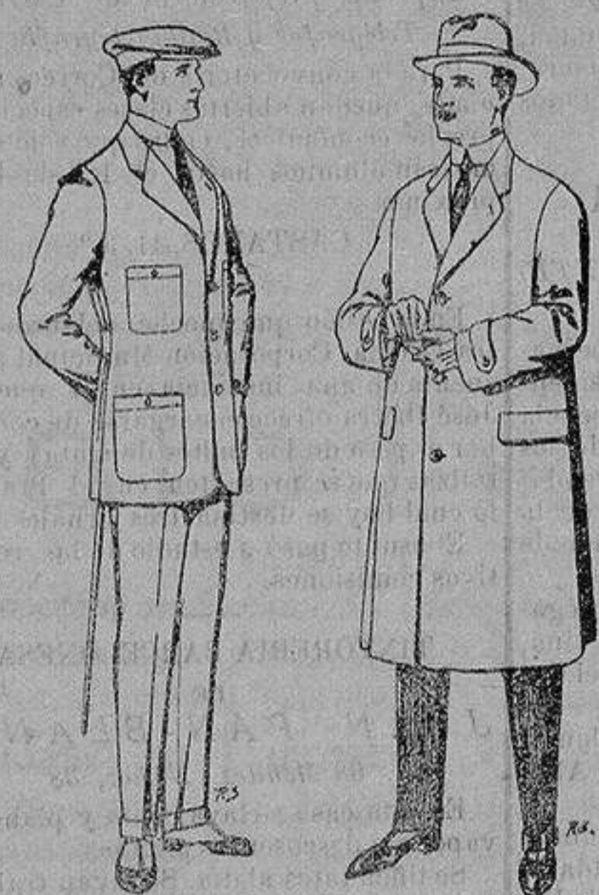
Trajes de cheviot corte elegante para «Sportman» De 35 a 50 ptas.

Madrid, Barcelona, Alicante, Almería, Bilbao, Cádiz, Cartagena, Gijón, Granada, Málaga, Palma de Mallorca, Santander, Sevilla, Valencia, Valladolid y Zaragoza