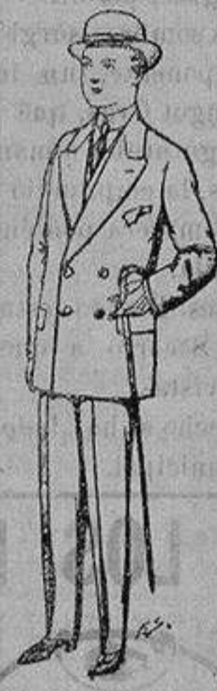
Trajes de patén, vicuña, etc., para niños de 10 a 16 años De ptas. 25 a 48