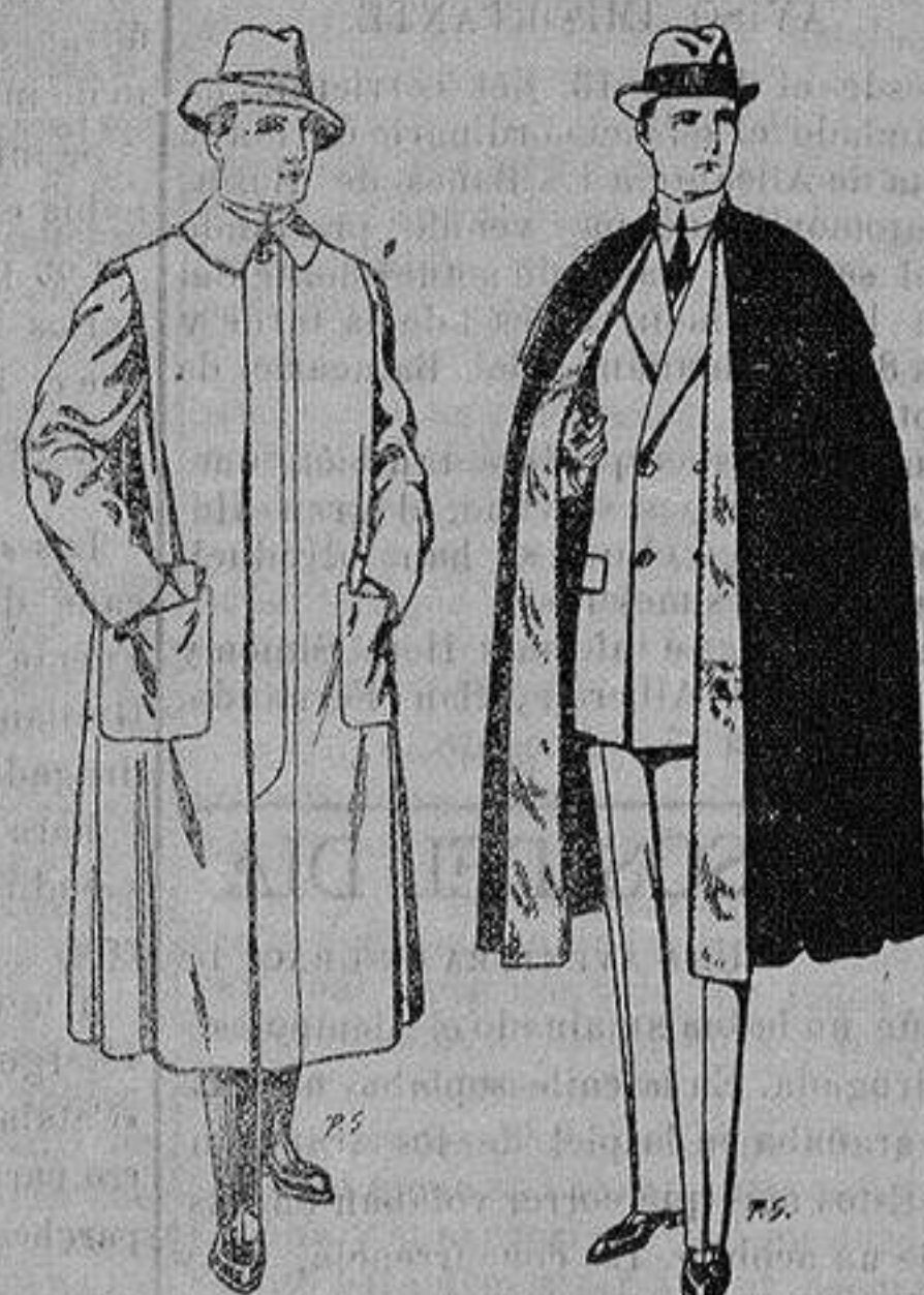
Impermeables forma gabán en color beige o gris De ptas. 35 a 100