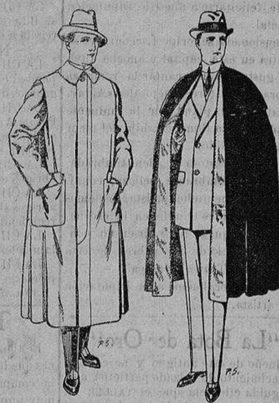
Impermeables forma gabán en color beige o gris De ptas. 35 a 100