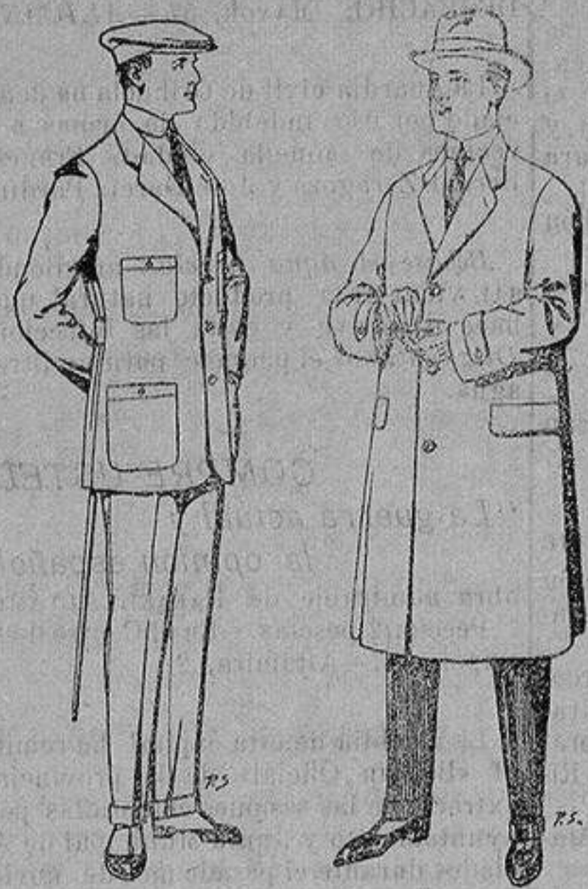
Trajes de cheviot corte elegante para «Sportman» De 35 a 50 ptas

Peletería, Camisería, Generos de Punto, Corbatería, Guantería, Sombrerería, Zapatería, Paraguas, Bas- tones y Artículos de Viaje.