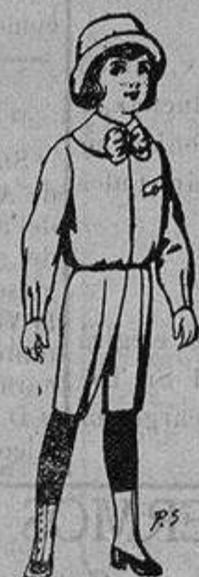
Trajes de patén para niños de 4 a 9 años De ptas. 5 a 7'50