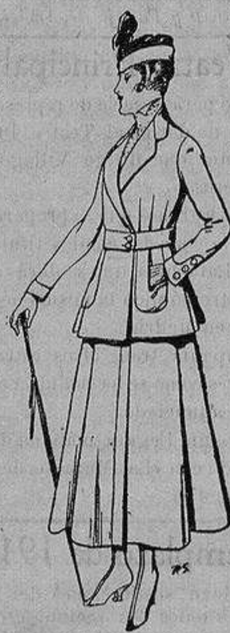
Trajes de lana negra azul y color, para se- ñora De ptas. 50 a 55