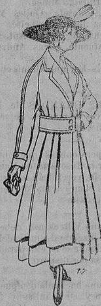
Abrigos de patén gran novedad para señora A ptas. 53