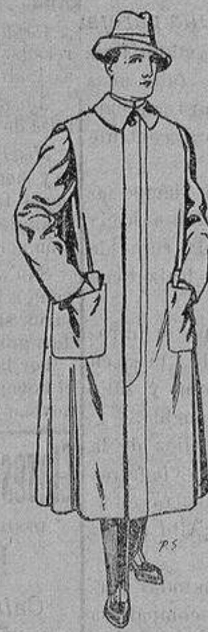
Impermeables forma gabán en color beige o gris De ptas. 35 a 100