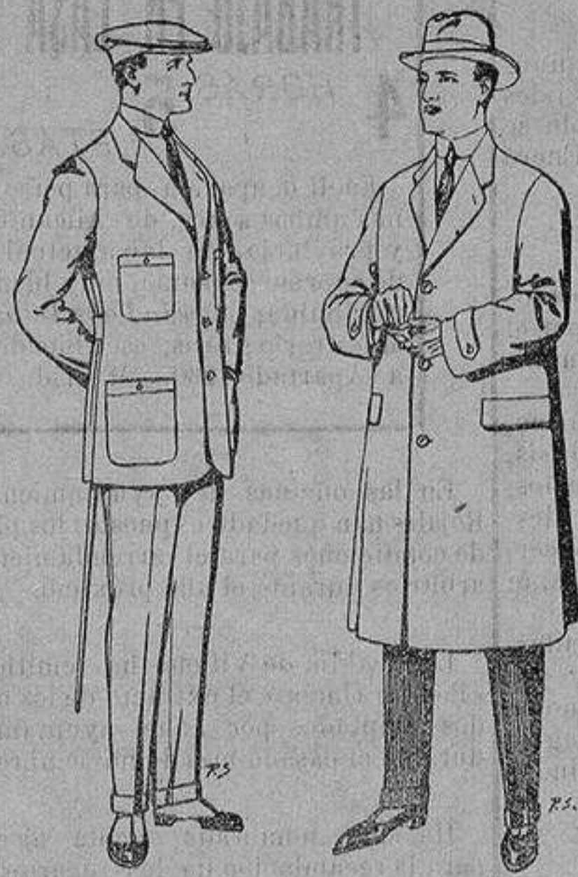
Trajes de cheviot corte elegante para «Sportman» De 35 a 50 ptas.

Peletería, Camisería, Generos de Punto, Corbatería, Guantería, Sombrerería, Zapatería, Paraguas, Bastones y Artículos de Viaje.