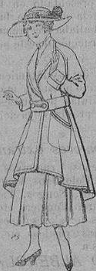
Abrigos de patén para jovencitas de 13 a 16 años De ptas. 25 a 35