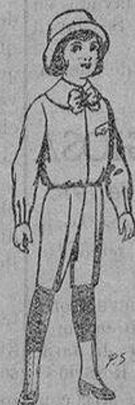
Trajes de patén para niños de 4 a 9 años De ptas. 5 a 7'50