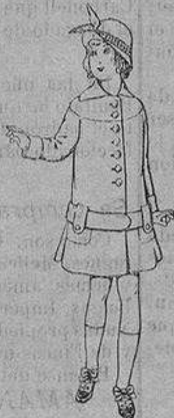
Abrigos de patén para niños de 4 a 12 años De ptas. 15 a 25