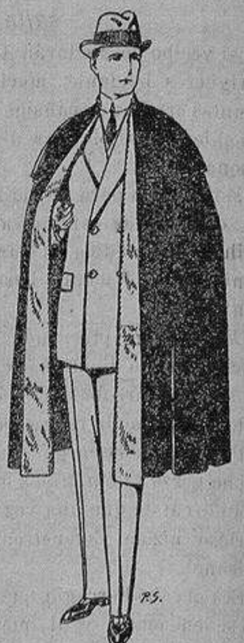
Capas (enteras) de paño De ptas. 25 a 100