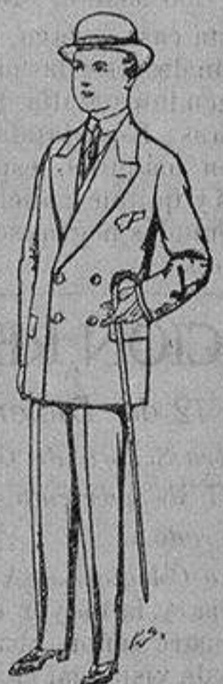
Trajes de patén, vicuña, etc., para niños de 10 a 16 años De ptas. 25 a 48