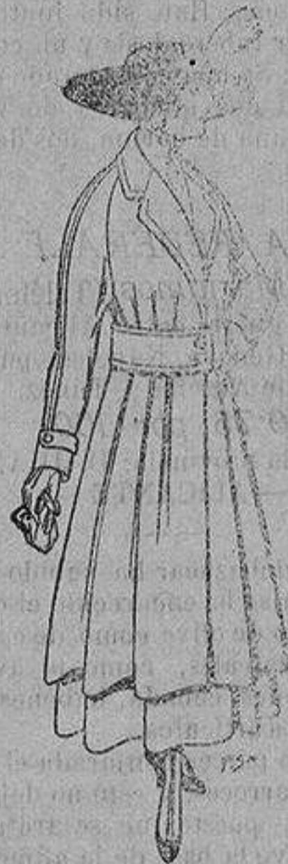
Abrigos de patén gran novedad para señora A ptas. 53