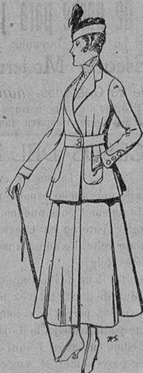
Trajes de lana negra azul y color, para señora De ptas. 50 a 55