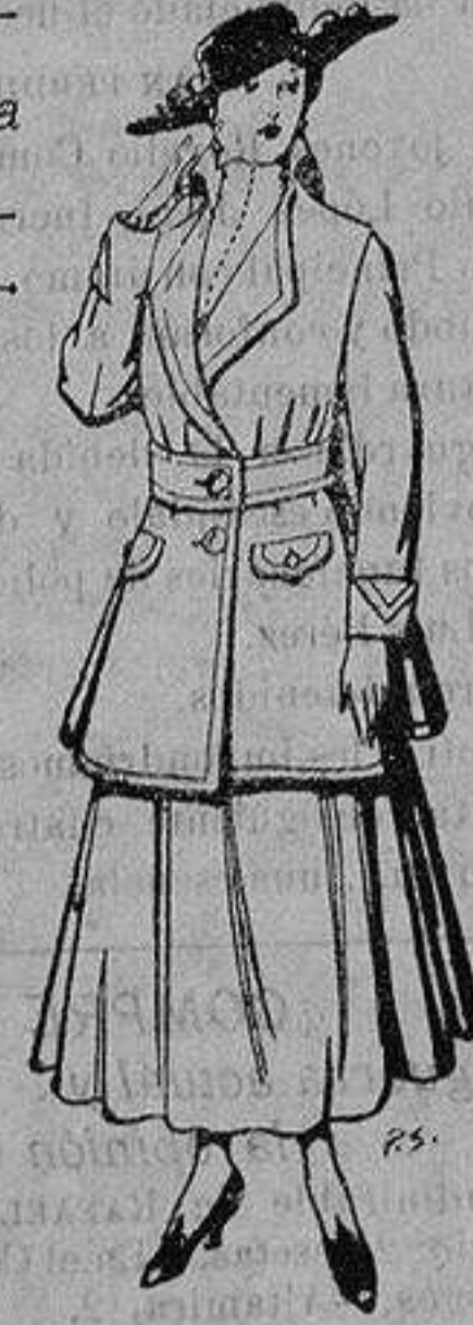
Abrigos de patén gran novedad para señora. De 26 a 40 ptas.