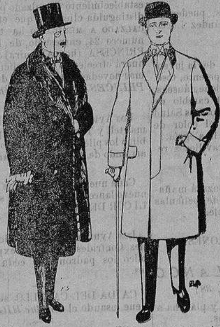
Gabanes de edredón negro, forro seda, cuello y vistas de piel. De 125 y 135 ptas

Madrid, Barcelona, Alicante, Almería, Bilbao, Cádiz, Cartagena, Gijón, Granada, Málaga, Palma de Mallorca, Santander, Sevilla, Valencia, Valladolid y Zaragoza