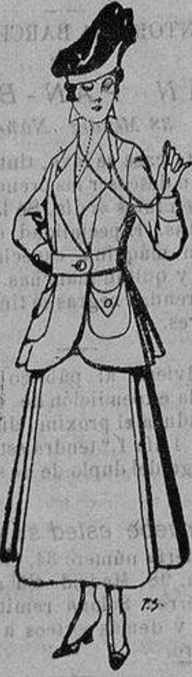
Trajes de lana negra, azul y color, para señora. De ptas. 50 a 55