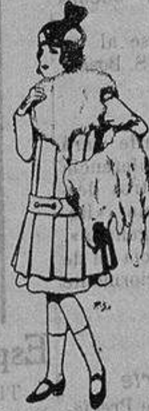
Juego de pieles para niñas. A ptas. 15