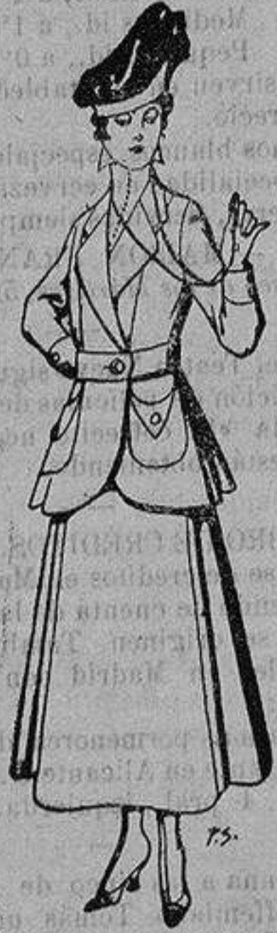
Trajes de lana negra, azul y color, para señora. De ptas. 50 a 55