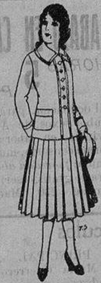
Paletot de lana para jovencitas de 13 a 16 años. De 12'50 a 20 ptas