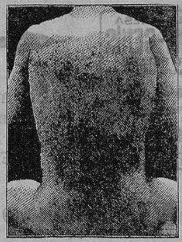
Antes de la curacion