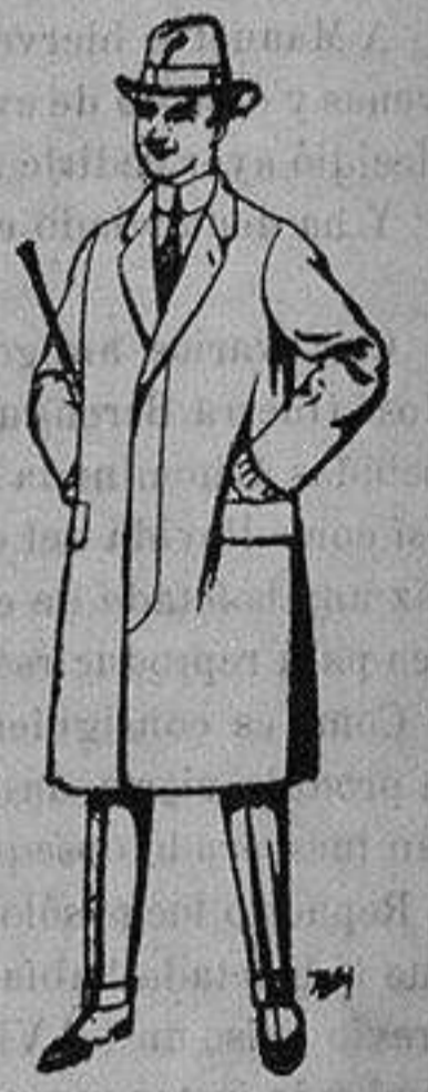
Gabanes de ana vigonia o melton, para niños de 10 a 16 años. De ptas. 20 a 56