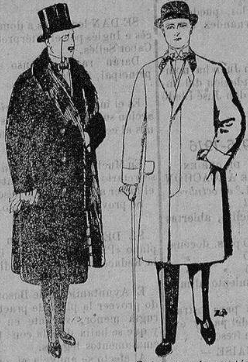
Gabanes de edredón negro, forro seda, cuello y vistas de piel. De 125 y 135 ptas. Gabanes de patén melton o cheviot. De 25 a 100 ptas.

Madrid, Barcelona, Alicante, Almería, Bilbao, Cádiz, Cartagena, Gijón, Granada, Málaga, Palma de Mallorca, Santander, Sevilla, Valencia, Valladolid y Zaragoza