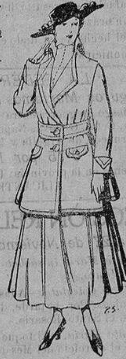
Abrigos de patén gran novedad para señora. De 26 a 40 ptas.