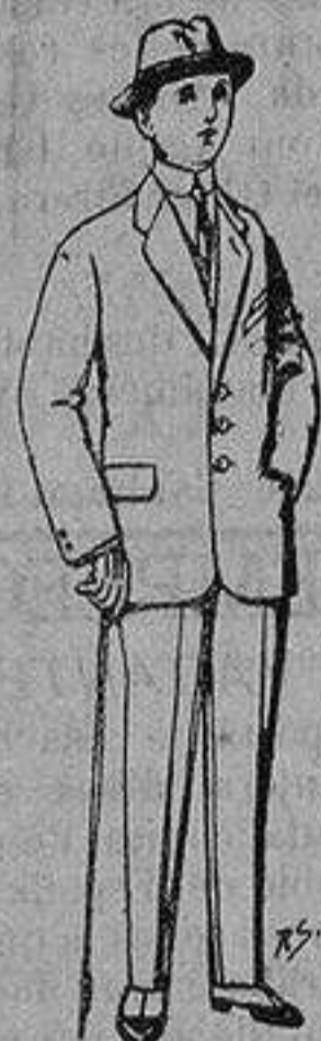
Trajes de patén, vicuña o jerga, para niños de 10 a 16 años. De 14 a 50 ptas.