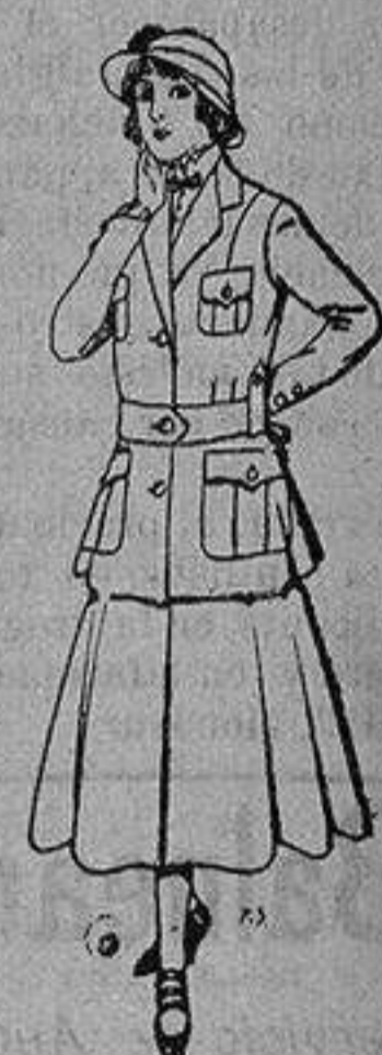
Trajes de lana para jovencitas de 13 a 16 años. De 40 a 45 pas.