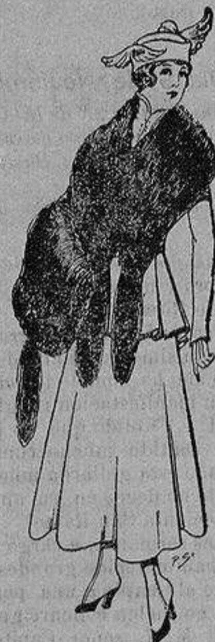
Juego de pieles imitación perfecta al renard negro. De 40 a 45 ptas.