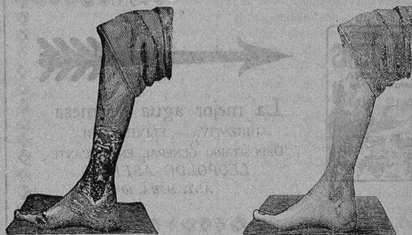
Antes de la curacion