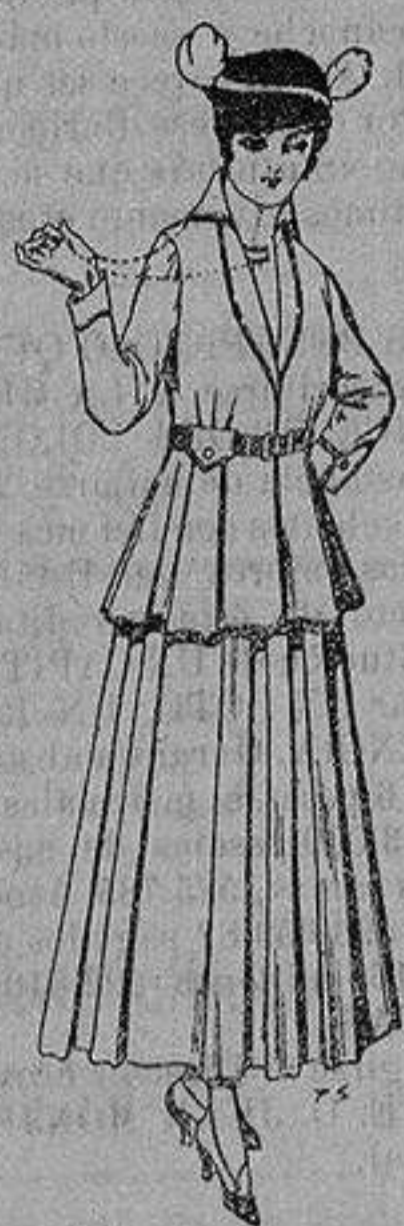
Trajes de lana negra, azul y color, para señora. A 85 ptas.