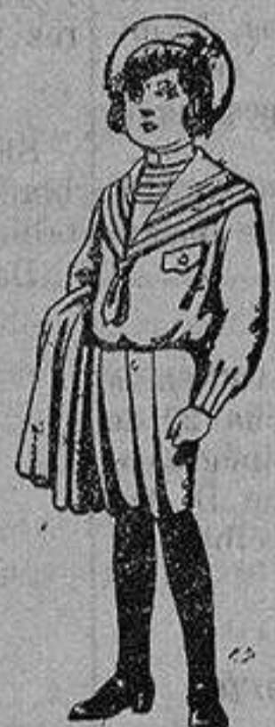
Trajes de jerga negra o azul, para niños de 4 a 9 años. De 5 a 10 ptas.