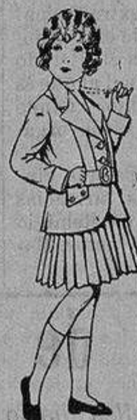
Trajes de lanilla para niñas de 4 a 12 años. De ptas. 20 a 35