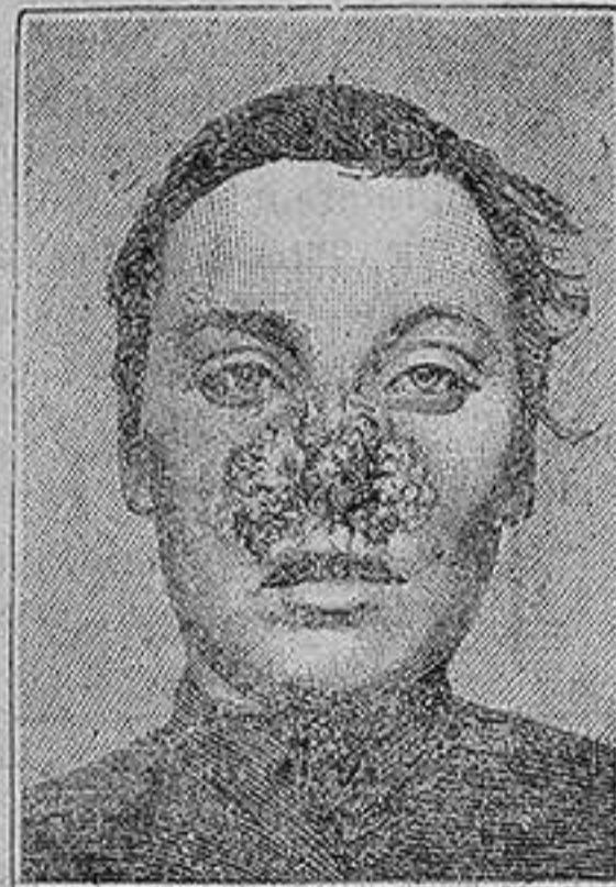
Antes de la curacion