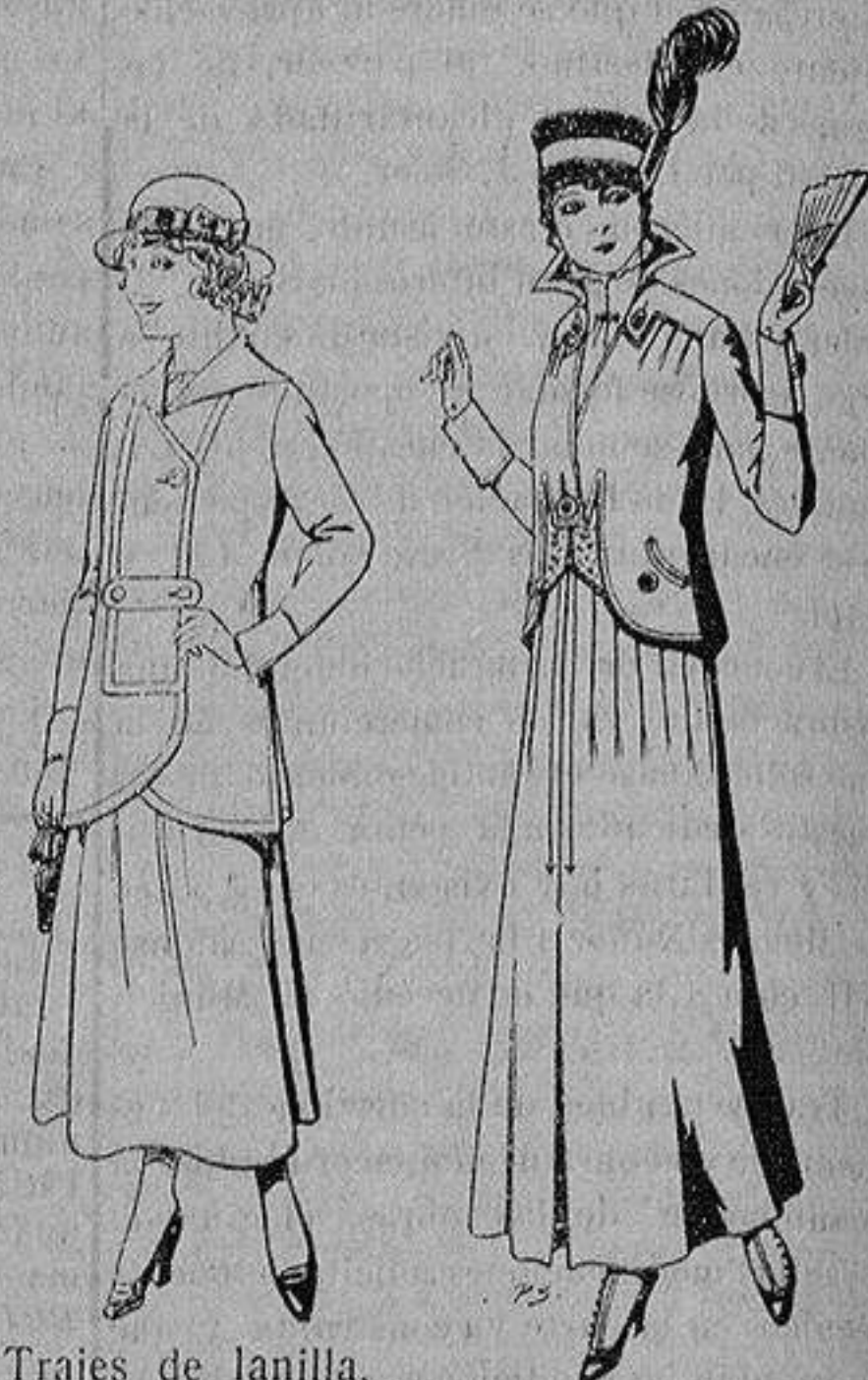
Trajes de lanilla, para jovencitas de de 13 a 15 años De ptas. 27 a 30 Trajes de lana negra, azul, para señora A 55 ptas.