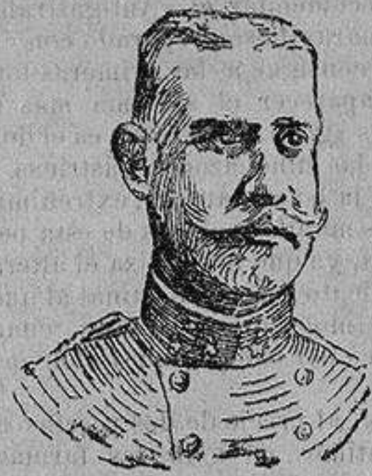
EL GENERAL FRANK

comandante del ejército austro-húngaro que opera contra los rusos en la Bukovina