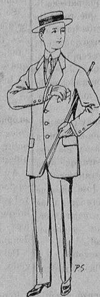
Trajes de lanilla, vi- cuña, etc., para niños de 10 a 16 años De ptas. 14 á 48