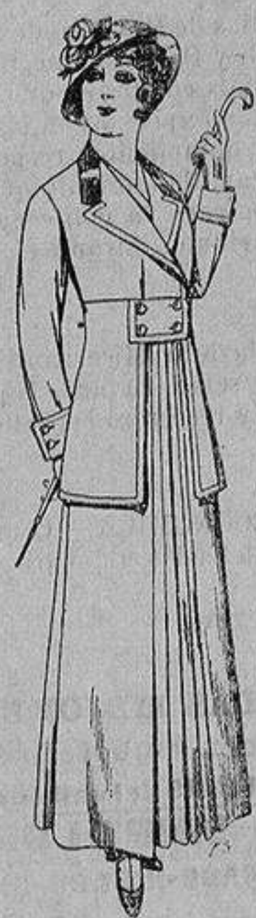
Trajes de lana ne- gra azul y color pa- ra señora A ptas. 70

Madrid * Barcelona * Almería * Bilbao * Cádiz Cartagena * Gijón * Granada * Málaga * Pal- ma de Mallorca * Santander * Sevilla * Valencia Valladolid y Zaragoza