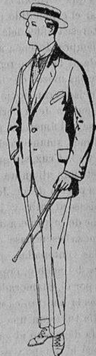
Trajes de alpaca negra De ptas. 32 a 56