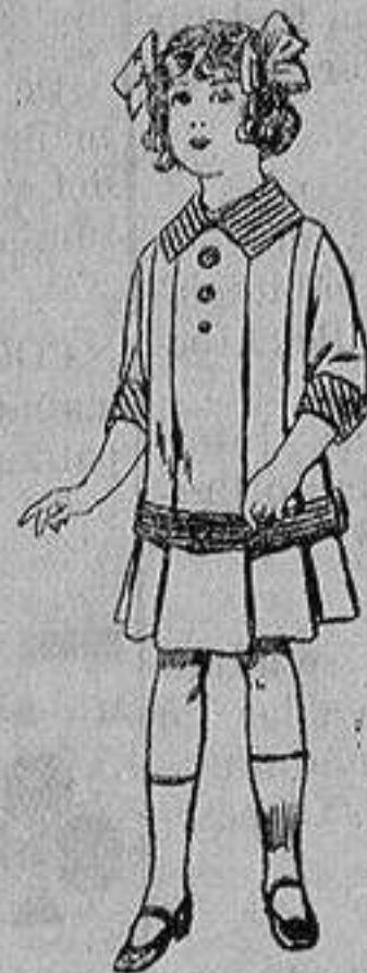
Vestidos de dril para niñas de 4 a 12 años De ptas. 5 a 12