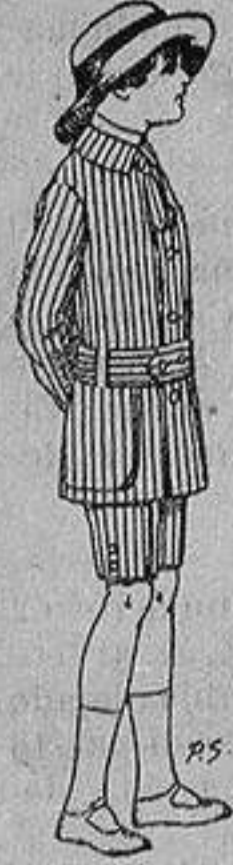
Trajes de dril listado para niños de 4 a 9 años De ptas. 4 a 13