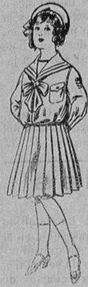
Trajes de lanilla, para niños de 4 a 12 años De ptas 28 á 38