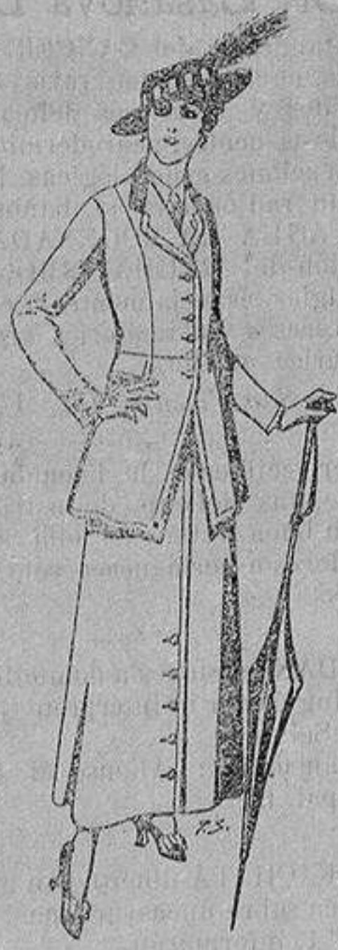
Trajes lana negra, azul y color A ptas. 55