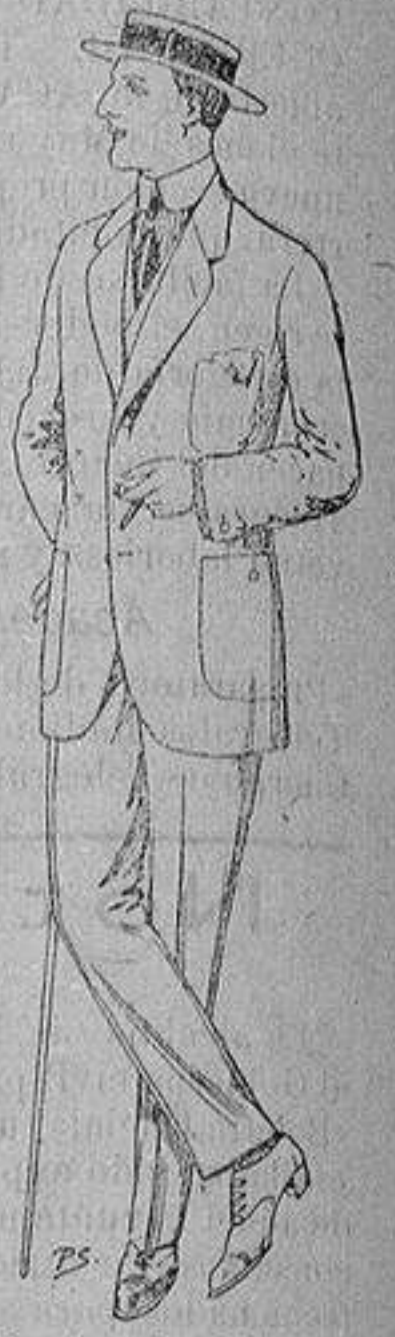
Trajes de dril crudo, kaki o listado De ptas. 10 a 32