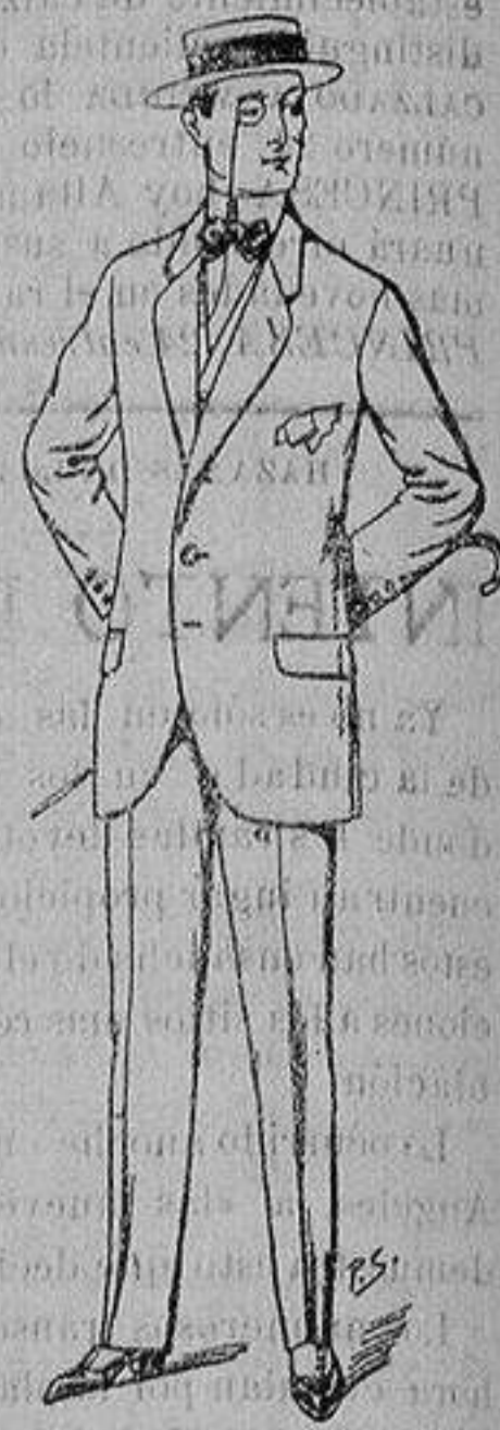
Trajes de lanilla, che- viot, etc. De ptas. 17'50 a 70