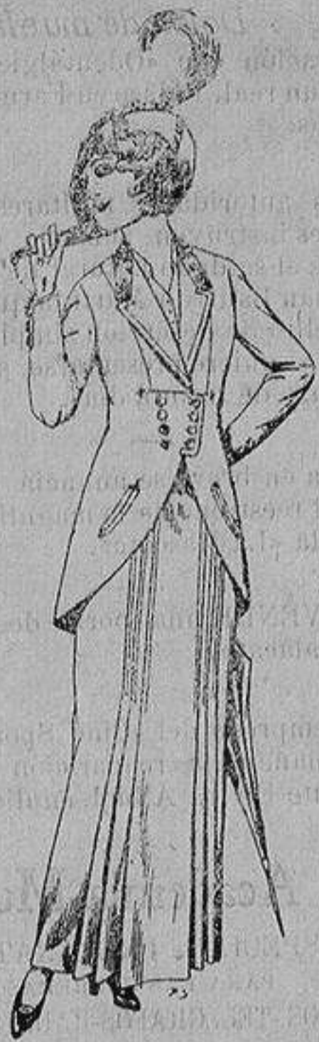
Trajes de lana ne- gra, azul y color pa- ra señora A ptas. 80