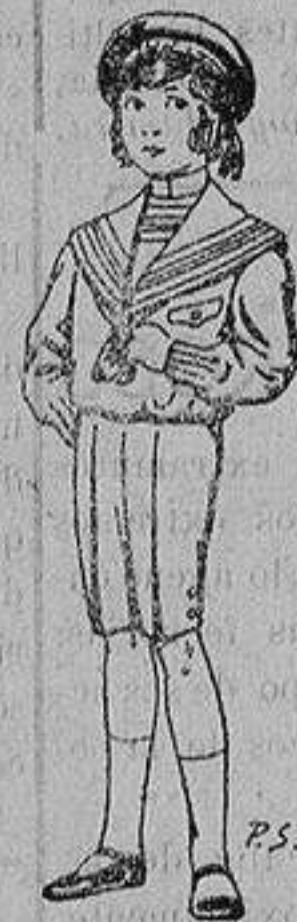
Trajes de lanilla, vicuña ó jerga, para ni- ños de 4 a 9 años De ptas. 6 á 31