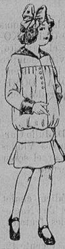
Vestidos lanilla para niñas de 4 a 12 años De ptas. 12 a 20