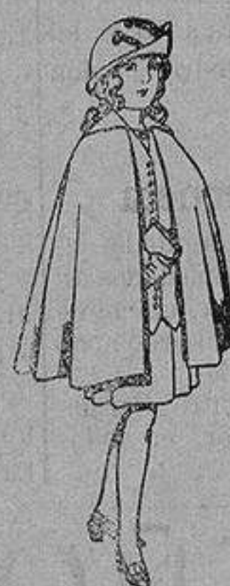
Capas de lana para niñas de 4 a 12 años De 20 a 22 ptas.