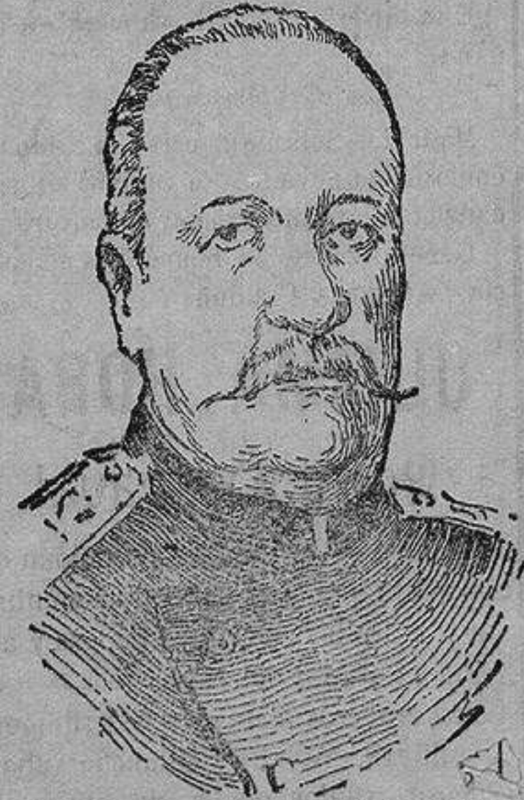
General conde VORONTZOW-DACHKOW antiguo ministro del zar Alejandro III, que después de vencer a los turcos en Sarhameycho y Karagan, marcha al frente de su ejército sobre Crzerun, capital de Armenia