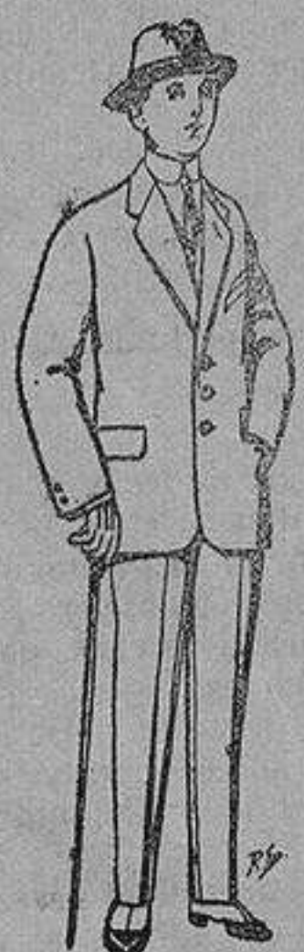
Trajes de pátén, vicuña, etc., para niños de 10 a 16 años De 13 a 48 ptas.