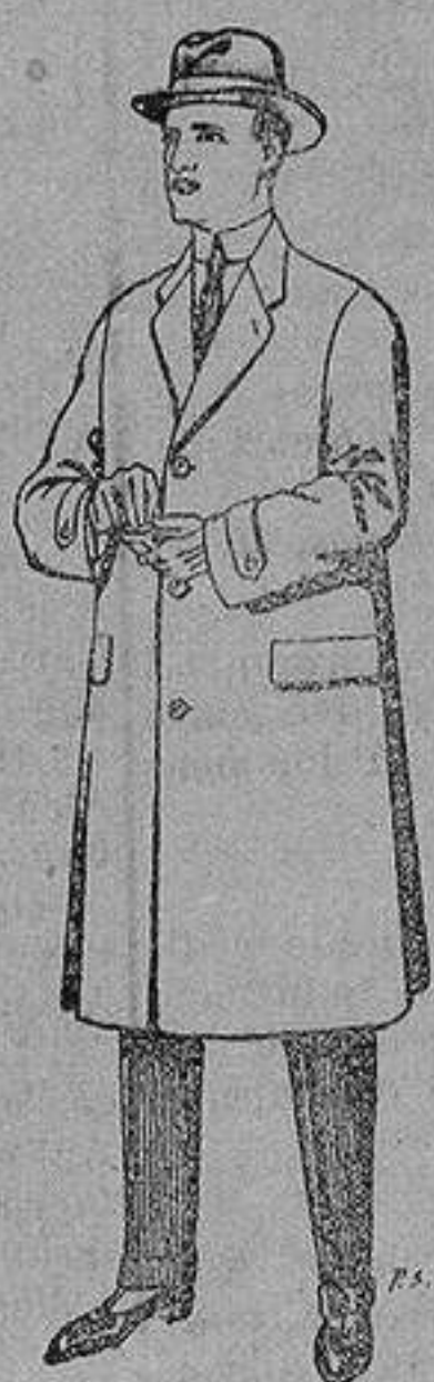
Gabanes de tejidos pluma satina, etc. De 17'50 a 70 ptas.