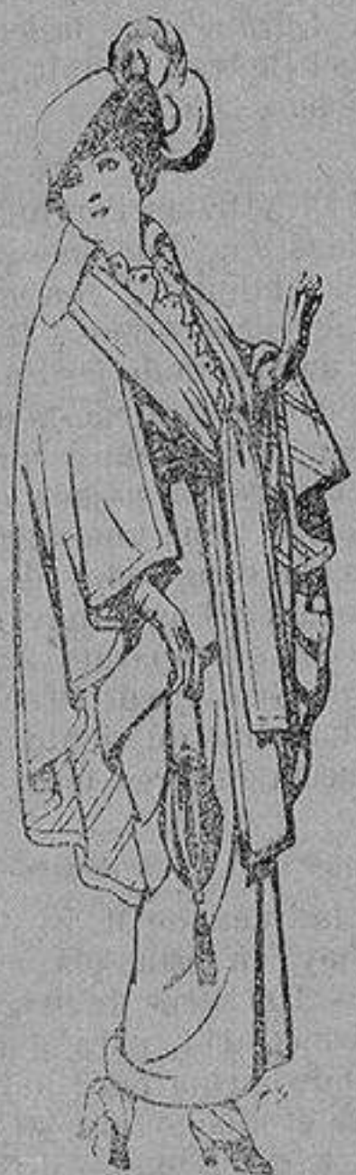
Capas de lana para señora A 20 ptas.