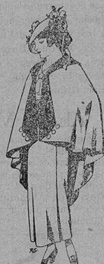
Capas de lana para jovencitas de 13 a 16 años A 25 pesetas