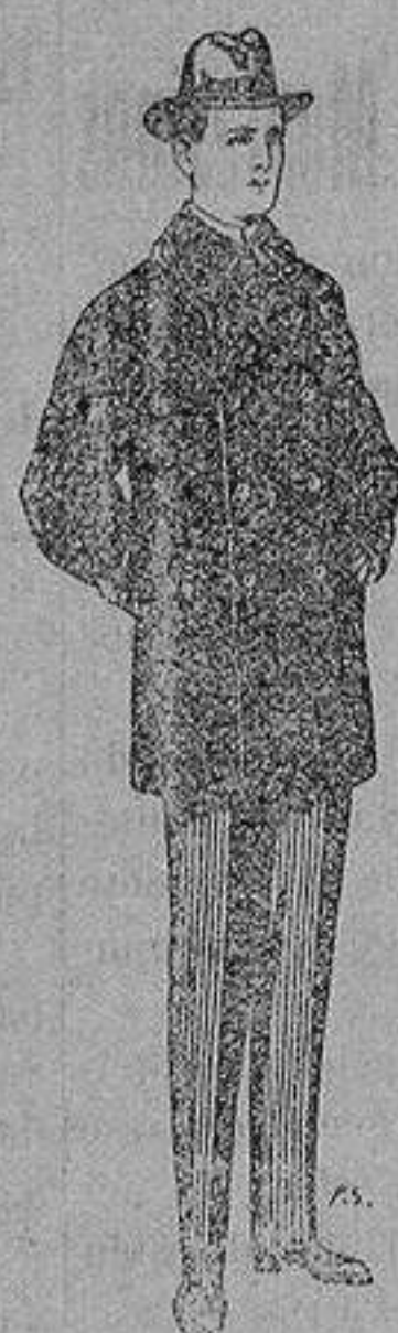
Pellizas con cuello y bocamangas de astrakan De 11 a 40 ptas

SECCIONES: Peletería, Camisería, Géneros de Punto, Corbatería, Guantería, Sombrerería, Zapatería, Paraguas, Bastones y Artículos de Viaje.