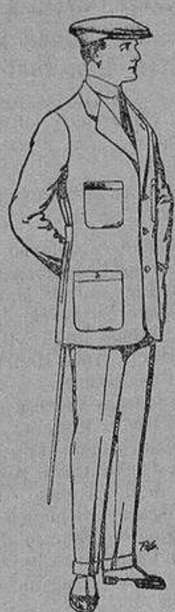
Trajes de cheviot, corte elegante para «Sportmen» De 45 a 55 ptas.

Madrid, Barcelona, Alicante, Almería, Bilbao, Cádiz, Cartagena, Gijón, Granada, Málaga, Palma de Mallorca, Santander, Sevilla, Valencia, Valladolid y Zaragoza