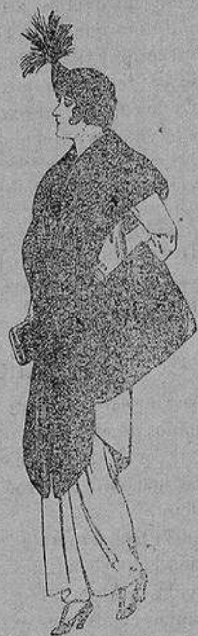
Juego de pieles de loutre de Nord para Señora 145 ptas.