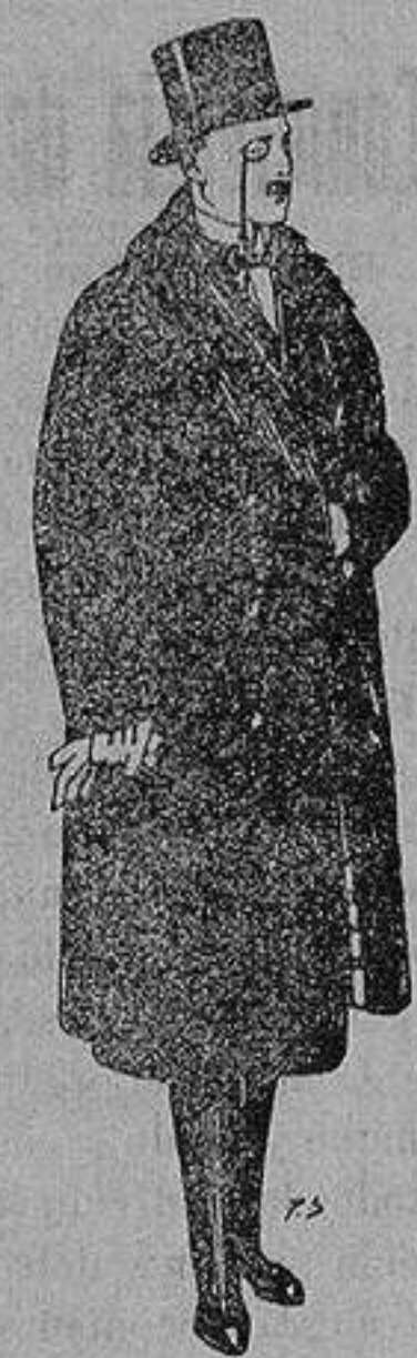
Gabanes de edredón negro, forro seda, cuello y vistas de piel a 125 ptas.