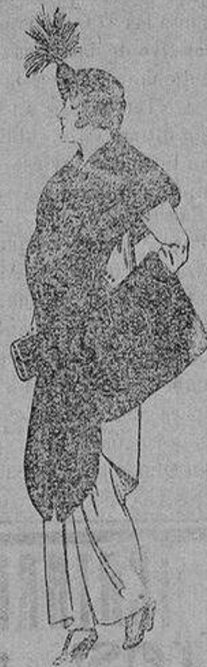
Juego de pieles de loutre de Nord para Señora 145 ptas.

SECCIONES: Peletería, Camisería, Géneros de Punto, Corbatería, Guantería, Sombrerería, Zapatería, Paraguas, Bastones y Artículos de Viaje.