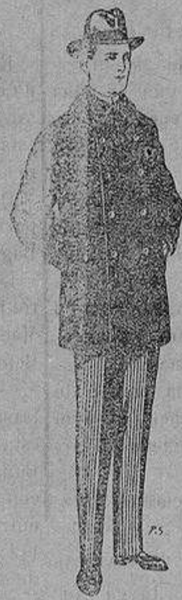
Pellizas con cuello y bocamangas de astrakan De 11 a 40 ptas