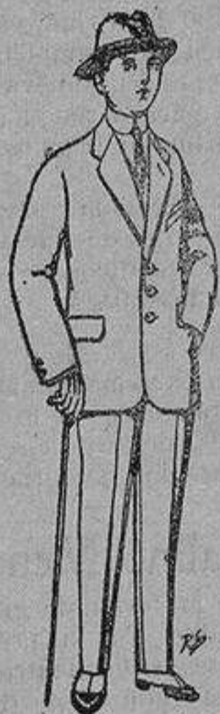
Trajes de paten, vicuña, etc., para niños de 10 a 16 años De 13 a 48 ptas.