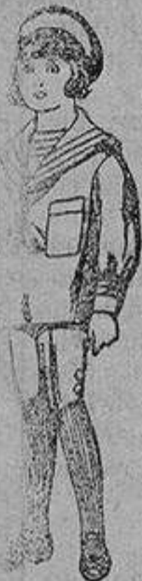
Trajes de jerga azul bordado oro en la manga para niños de 4 a 9 años De 20 a 22 ptas.

Ropas confeccionadas para Caballero, Señora, Niño y Niña