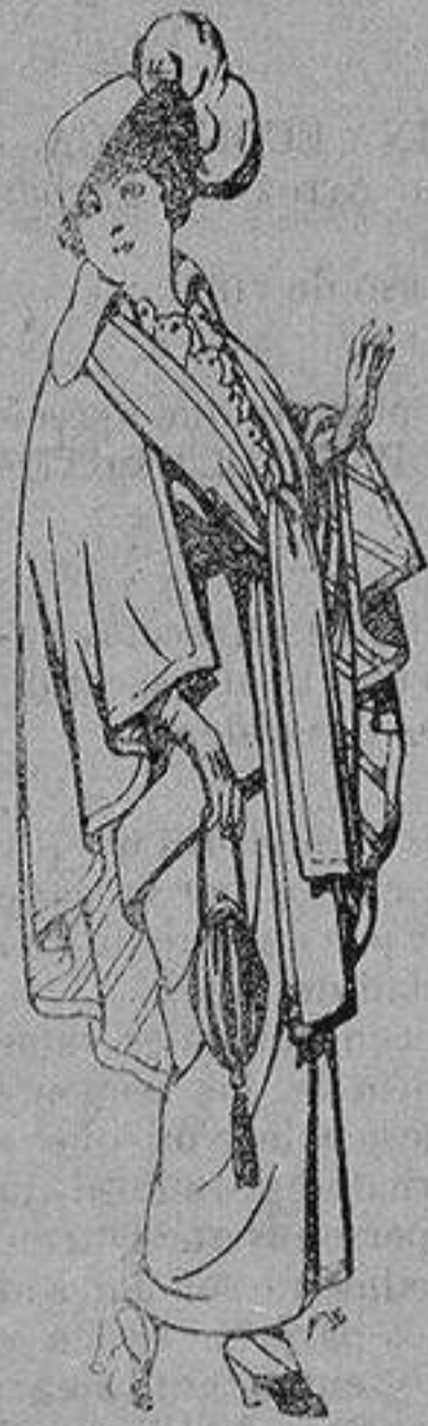
Capas de lana para señora A 20 ptas.