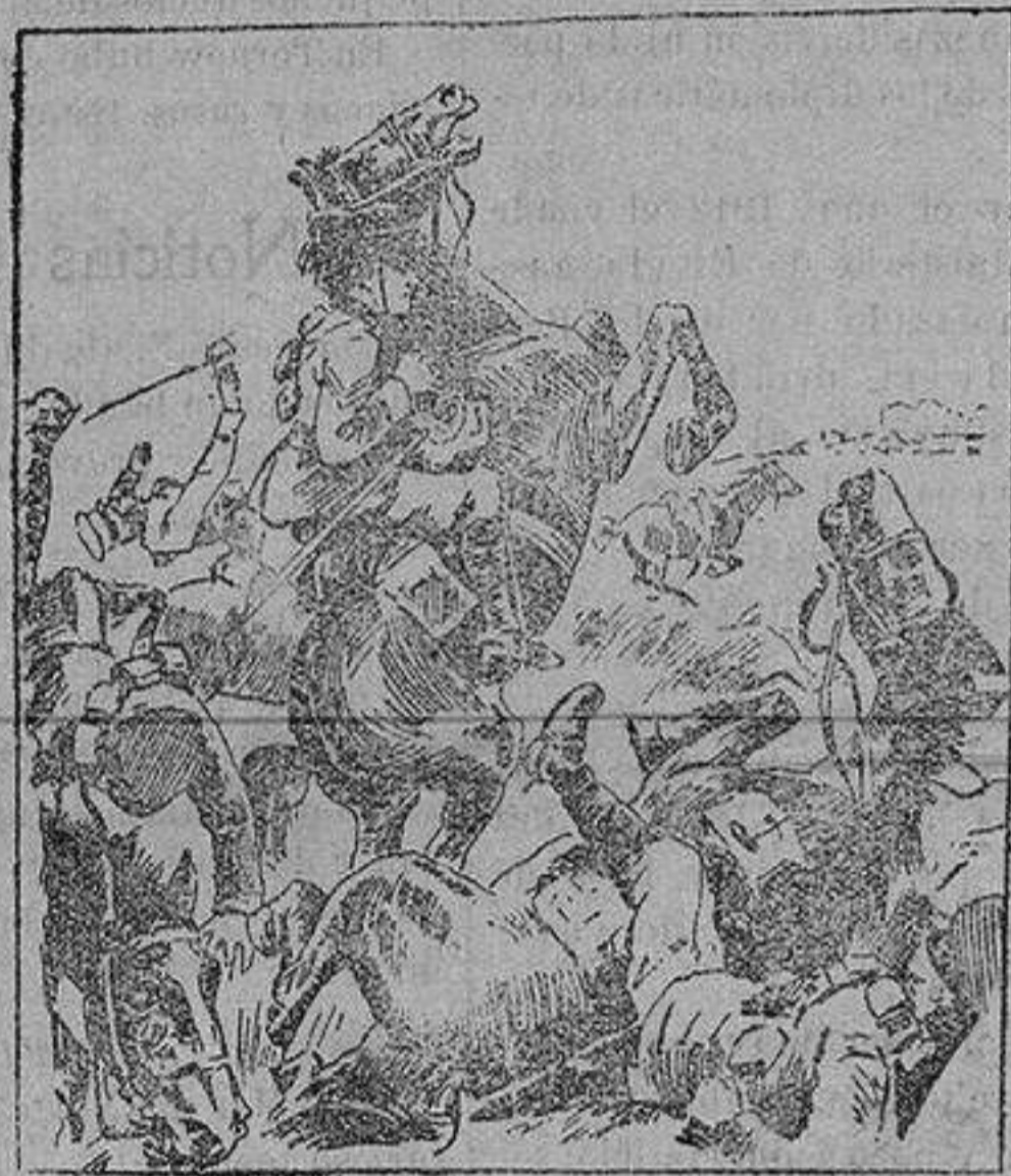
Caballería inglesa detenida durante una carga por el fuego de las ametralladoras alemanas