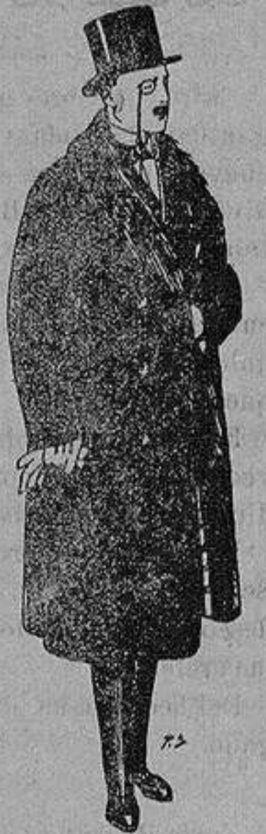
Gaban es de edredón negro, forro seda, cuello y vistas de piel a 125 ptas.