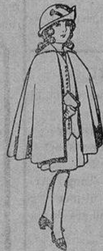
Capas de lana para niñas de 4 a 12 años De 20 a 22 ptas.