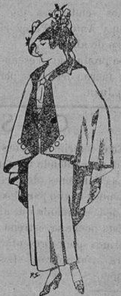
Capas de lana para jovencitas de 13 a 16 años A 25 pesetas