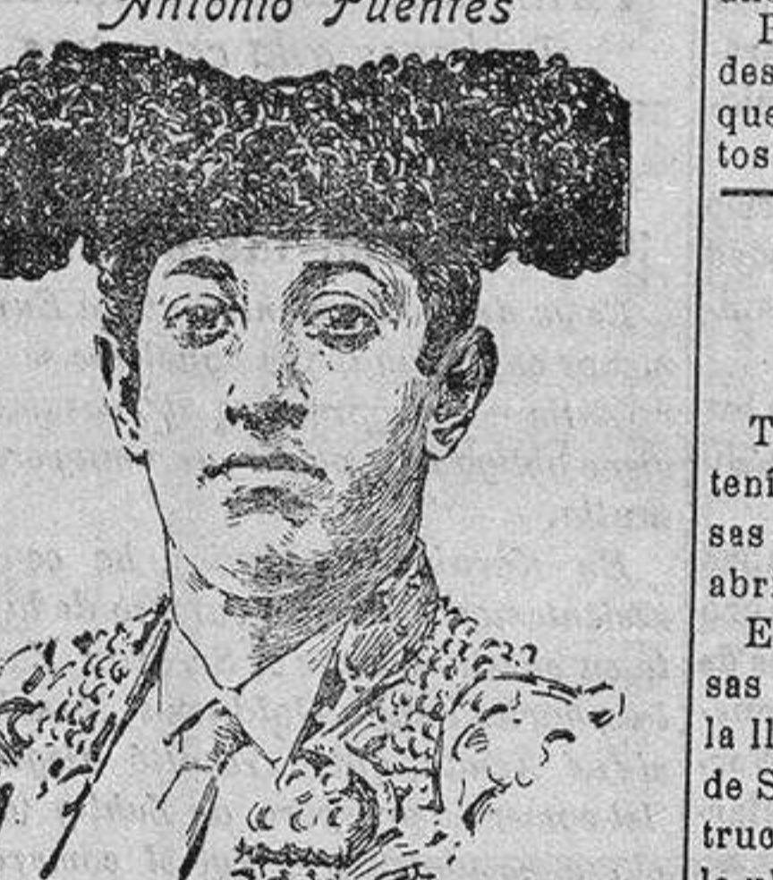
que tan gravemente herido resultó en la corrida de toros celebrada el domingo en Santander