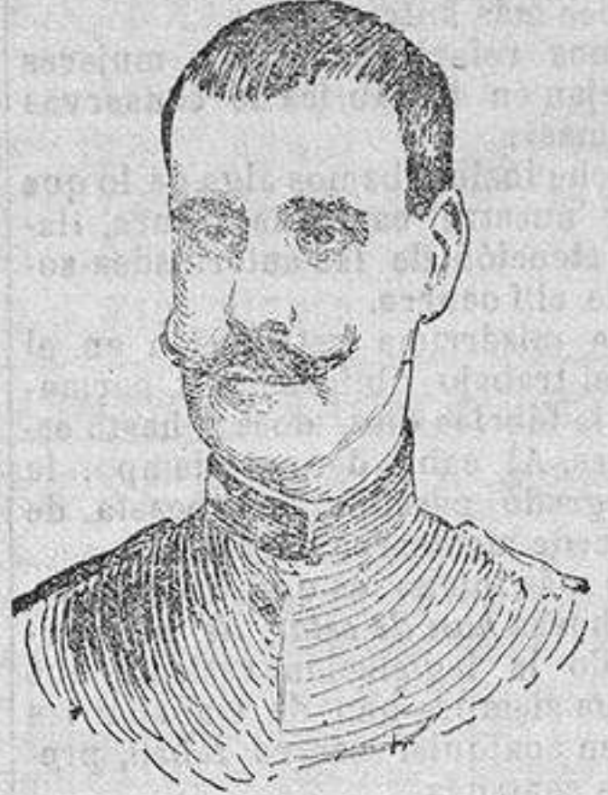
Capitán Paiva Couceiro jefe del actual movimiento monárquico de Portugal