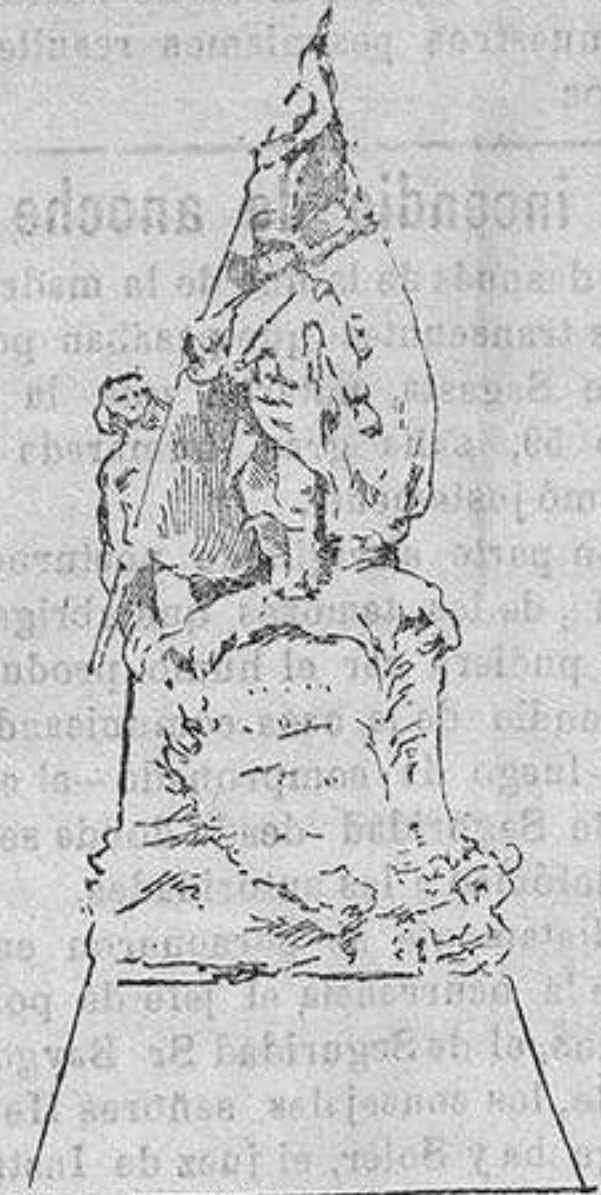
Monumento erigido al cabo Noval, en uno de los jardines de la Plaza de Oriente de Madrid

PLATO DEL DIA PARA MAÑANA JUEVES Paella a la Valenciana