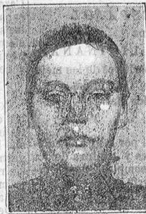
Después de la curación