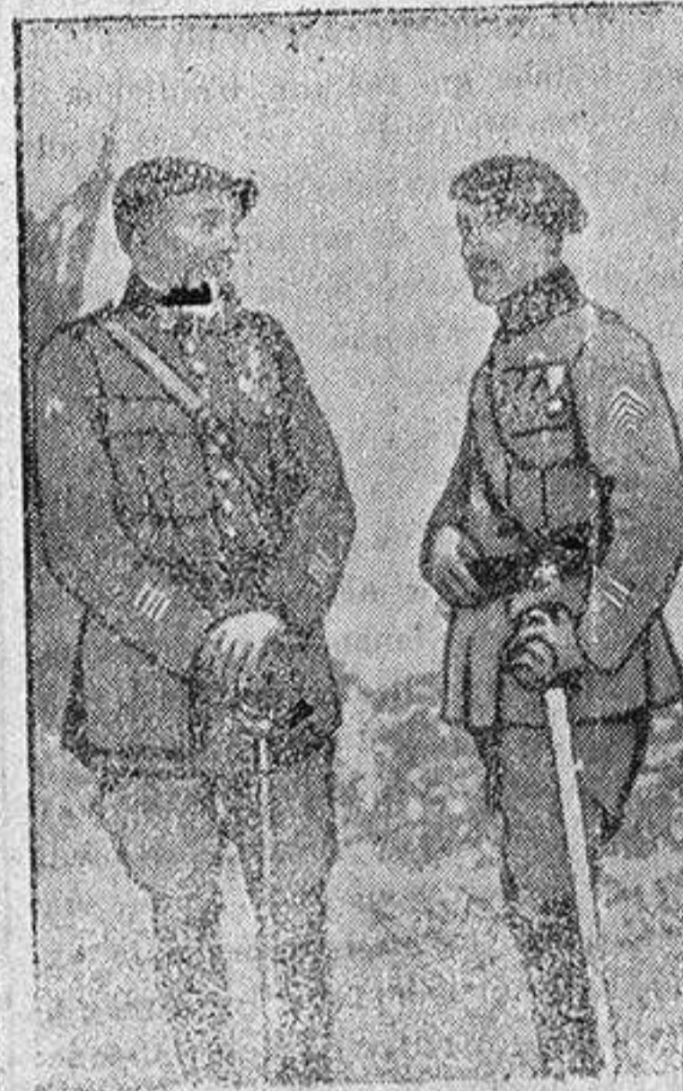
El comandante de un batallón de cazadores que tomó el Monte Tomba.