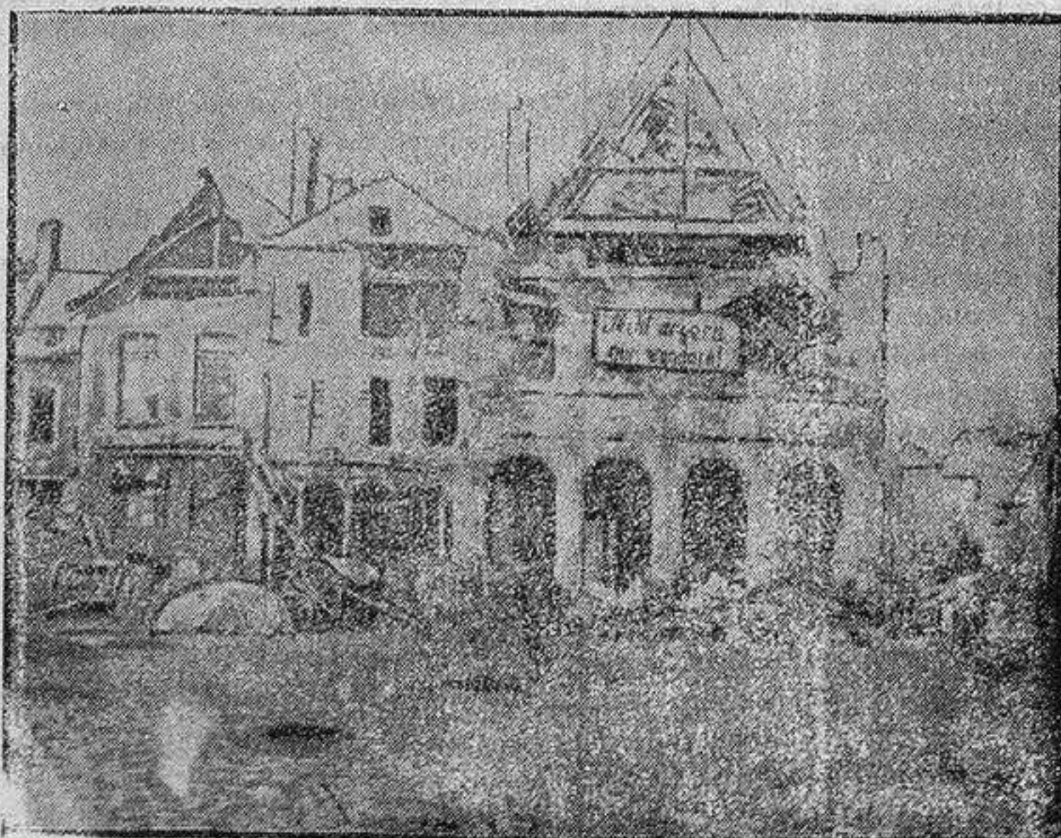
PLAZA DEL AYUNTAMIENTO DE PERONNE