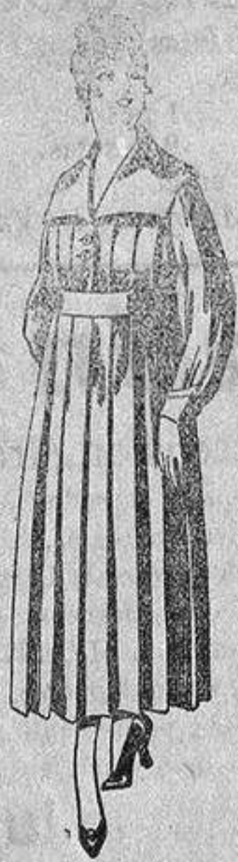
Batas de lanilla diferentes colores, a pesetas, 25.

Madrid, Barcelona, Alicante, Almería, Bilbao, Cádiz, Cartagena, Gijón, Granada, Málaga, Palma de Mallorca, Santander, Sevilla, Valencia, Valladolid y Zaragoza.