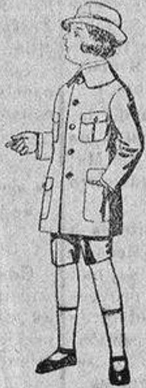
Trajes de patén modelo «Sport», para niños de 4 a 9 años.