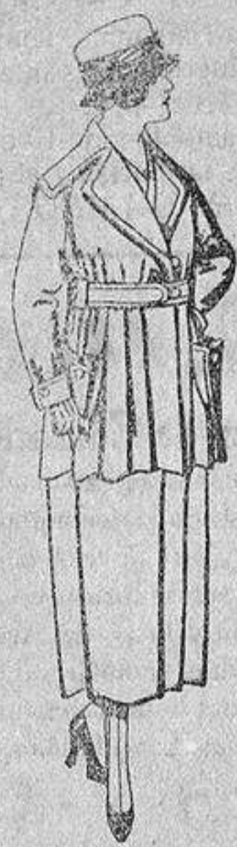
Paletots felpa de seda, diferentes colores, de ptas. 60 a 65.