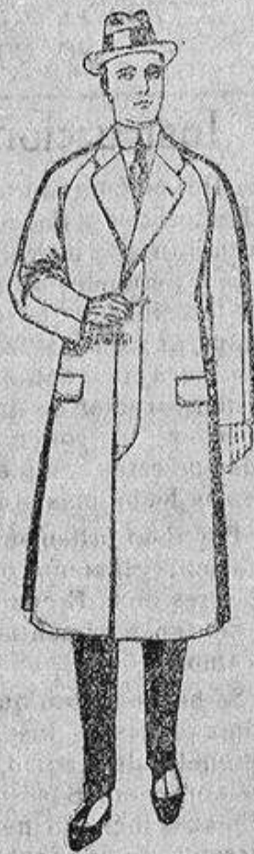
Gabanes de patén, melton o cheviot, con forro de seda, satén o escocés, de ptas. 80 a 100.