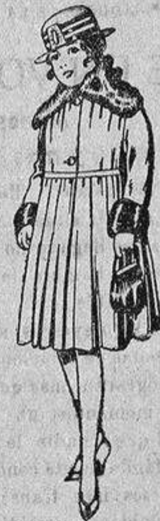
Abrigos de terciopelo de lana, pañete, gamuza, etc., cuello y boca mangas piel, para niñas de 4 a 9 años, de pesetas 28 a 48.

Camisería - Géneros de punto Gorbatería - Guantería Sombrerería - Zapatería Paraguas - Bastones y artículos - - - de viaje - - -