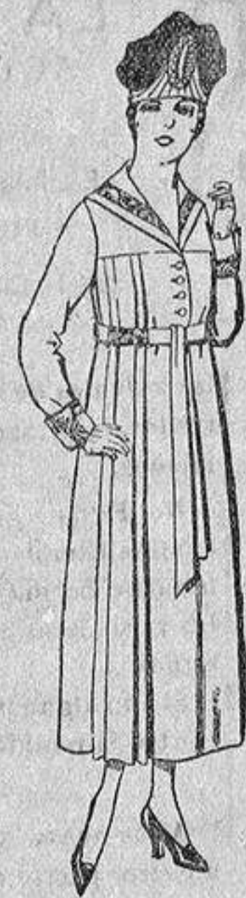
Vestidos de sarga inglesa, en negro, azul y color, bordados, de de ptas. 60 a 70.