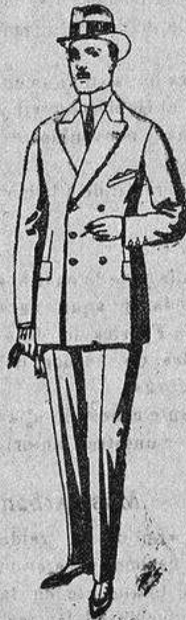
Trajes de cheviot, melton etc., de ptas. 26 a 85. Los mismos en vicuña o jerga, de ptas. 32 a 90.

Ultimas novedades en echarpes, manguitos, pelerinas, corbatas, abrigos, etc., en pieles de loure, taupe, vison, renard, zibeline, armiño, etc., auténticas e imitación perfecta.