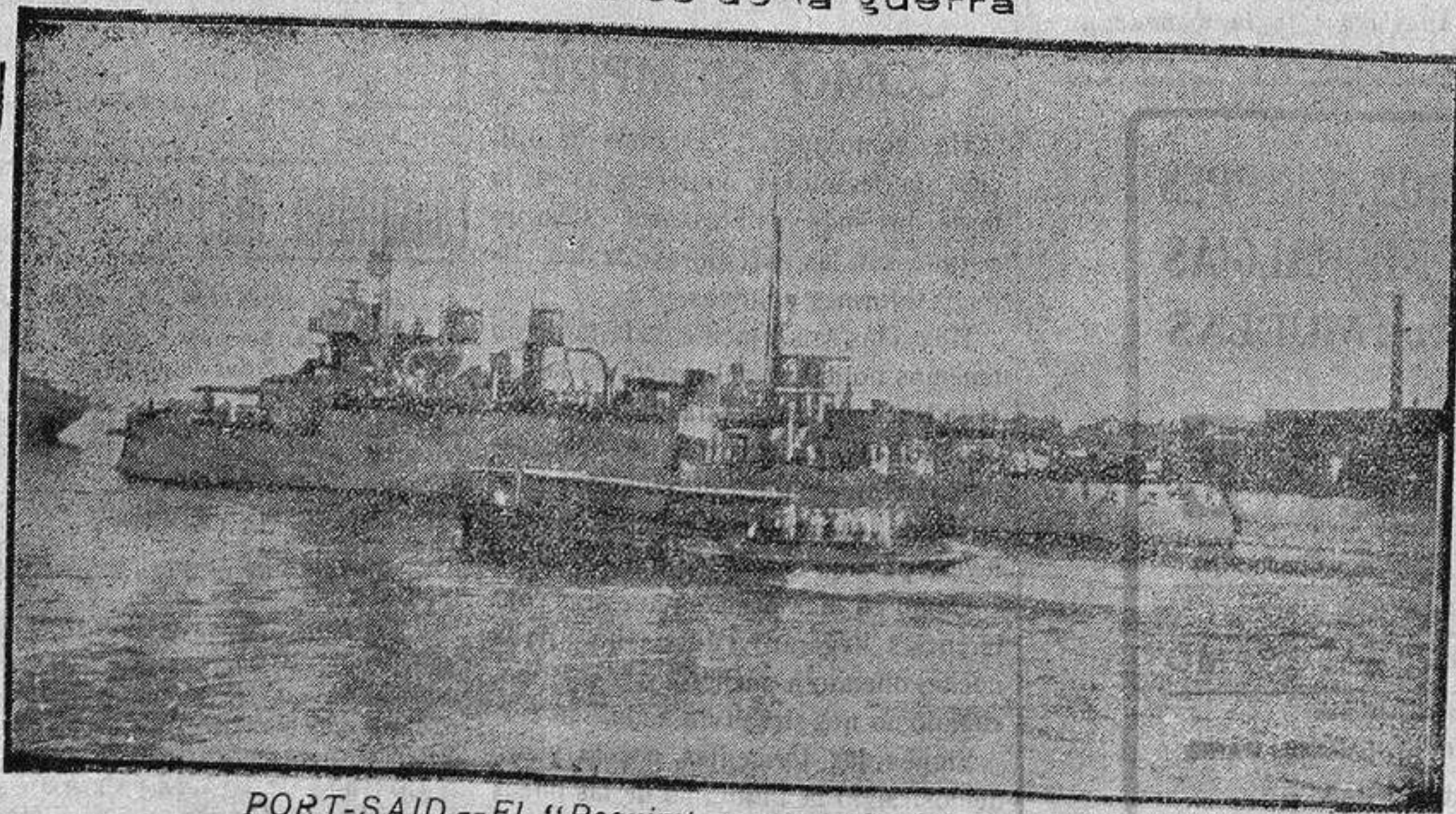
PORT-SAID.—El «Requin» regresando del ataque a Gaza