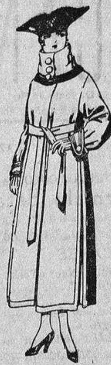
Abrigos de pañete, colores azul, beige y café, de pes 65 a 85.