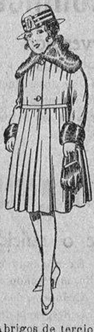
Abrigos de terciopelo de lana, pañete, gamuza, etc., cuello y bocamangas piel, para niñas de 4 a 9 años, de pesetas 28 a 48.

PRECIO FIJO - VENTAS AL CONTADO - Pídase el Catálogo general