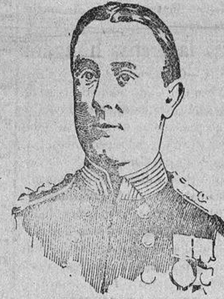
Almirante Jellicoe que ha sido destituido del mando de la flota inglesa