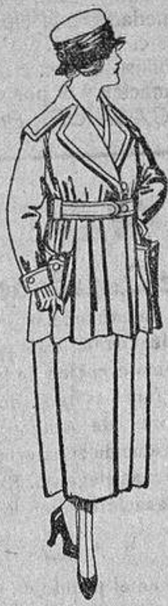
Paletots felpa de seda, diferentes colores, de ptas. 60 a 65.