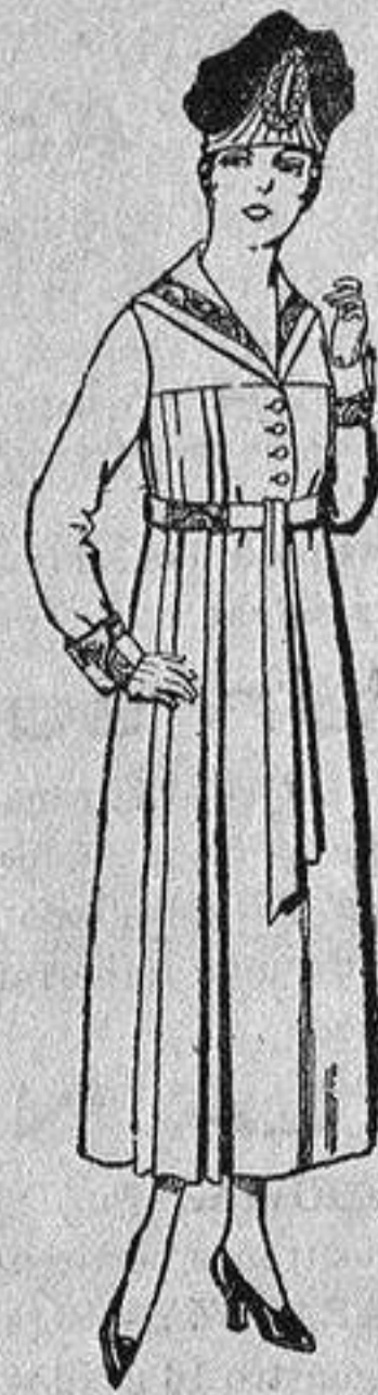
Vestidos de sarga inglesa, en negro, azul y color, bordados, de de ptas. 60 a 70.