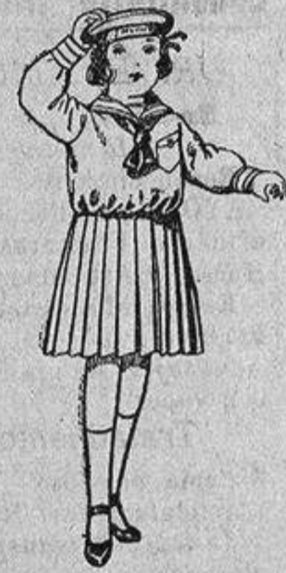
Trajes de marinera de sarga inglesa azul, para niñas de 4 a 9 años, de ptas. 30 a 38.