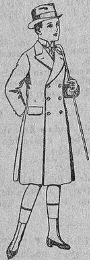
Gabanes de patén para niños de 4 a 9 años, de ptas. 16 a 50.