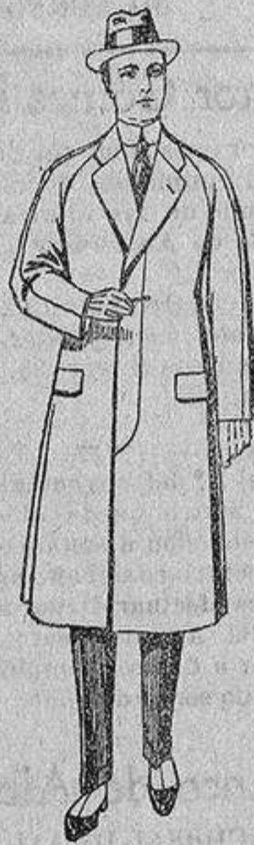
Gabanes de patén, melton o cheviot, con forro de seda, satén o escocés, de ptas. 50 a 100.