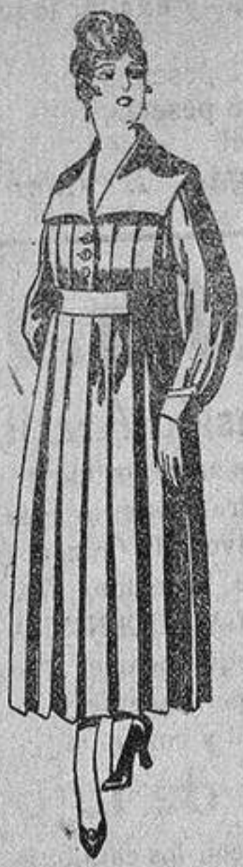
Batas de lanilla diferentes colores, a pesetas, 25.

Madrid, Barcelona, Alicante, Almería, Bilbao, Cádiz, Cartagena, Gijón, Granada, Málaga, Palma de Mallorca, Santander, Sevilla, Valencia, Valladolid y Zaragoza.