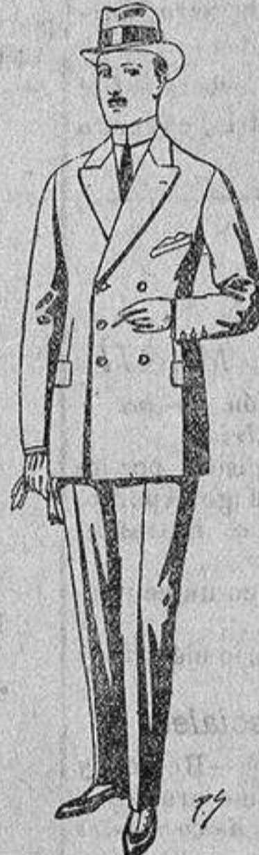
Trajes de cheviot, melton etc., de ptas. 26 a 85. Los mismos en vieuña o jerga, de ptas. 32 a 90.

Gamisería - Géneros de punto Corbatería - Guantería Sombrerería - Zapatería Paraguas - Bastones y artículos de viaje