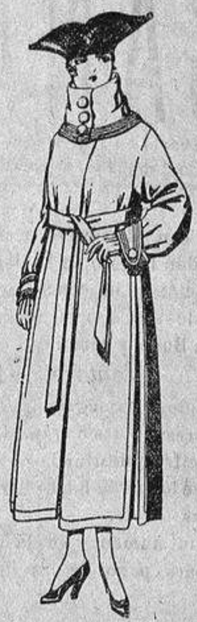
Abrigos de pañete, colores azul, beige y café, de pes 65 a 85.