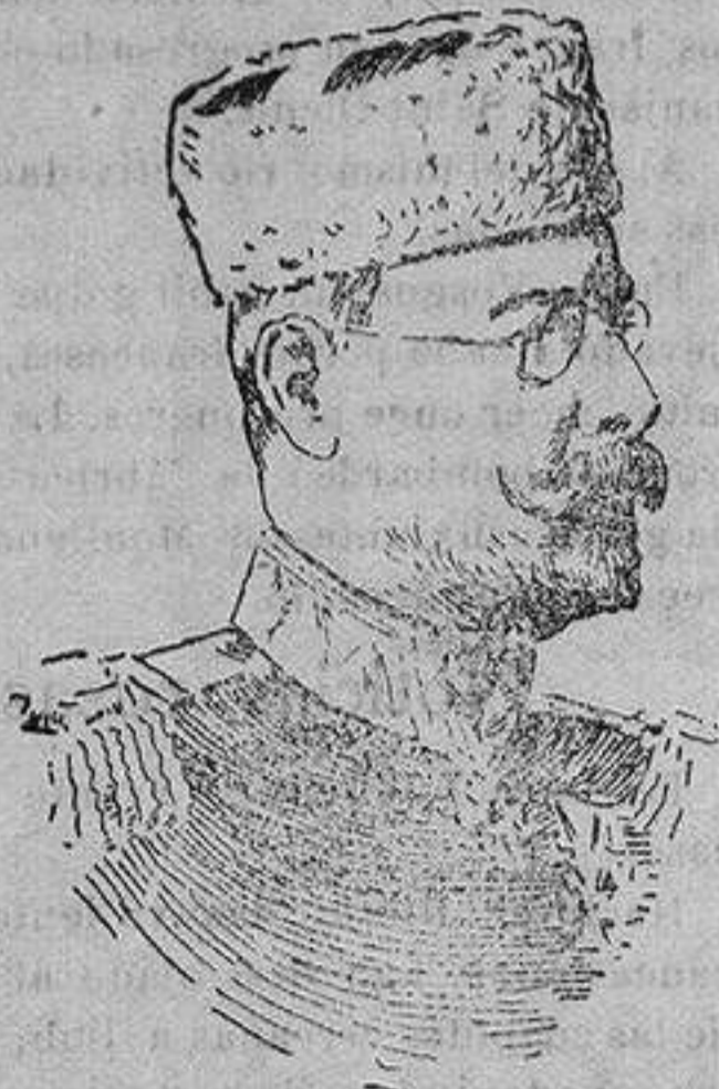
General LUKOFF, nuevo jefe del Estado Mayor búlgaro