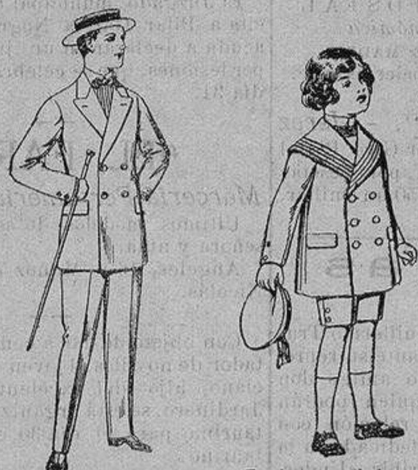
Trajes de lanilla, para jovencitos de 10 a 16 años. De ptas. 17 a 48 Trajes modelo maletot, de vicuña azul para niños de 4 a 9 años. De ptas. 12 a 31