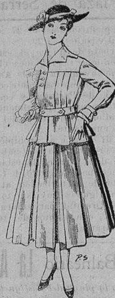
Trajes de lanilla negra azul y color, para señora. A ptas. 105