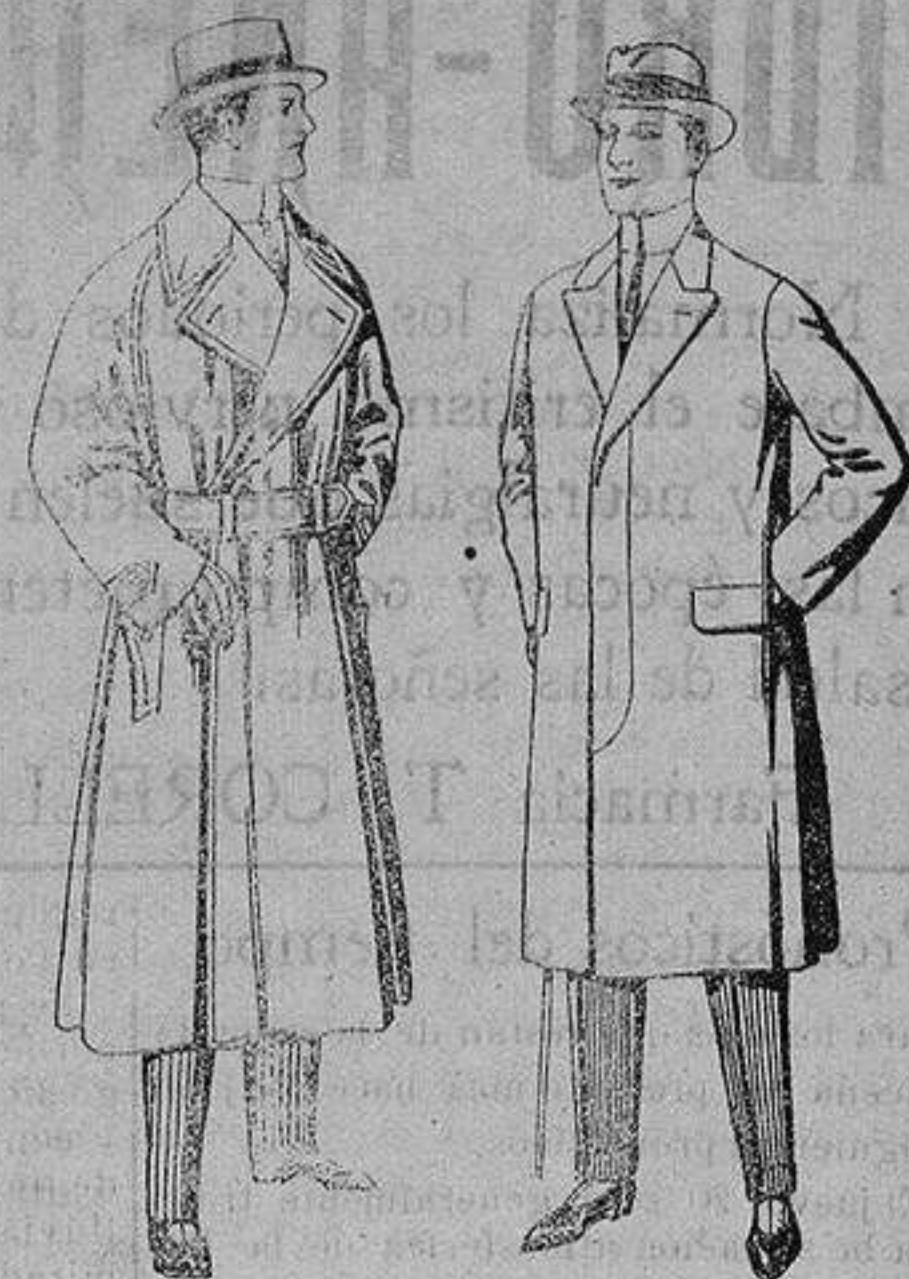
Gabanes impermeabilizados en color l'eiige. Pardésús de melton o vigonia. De ptas 25 a 100