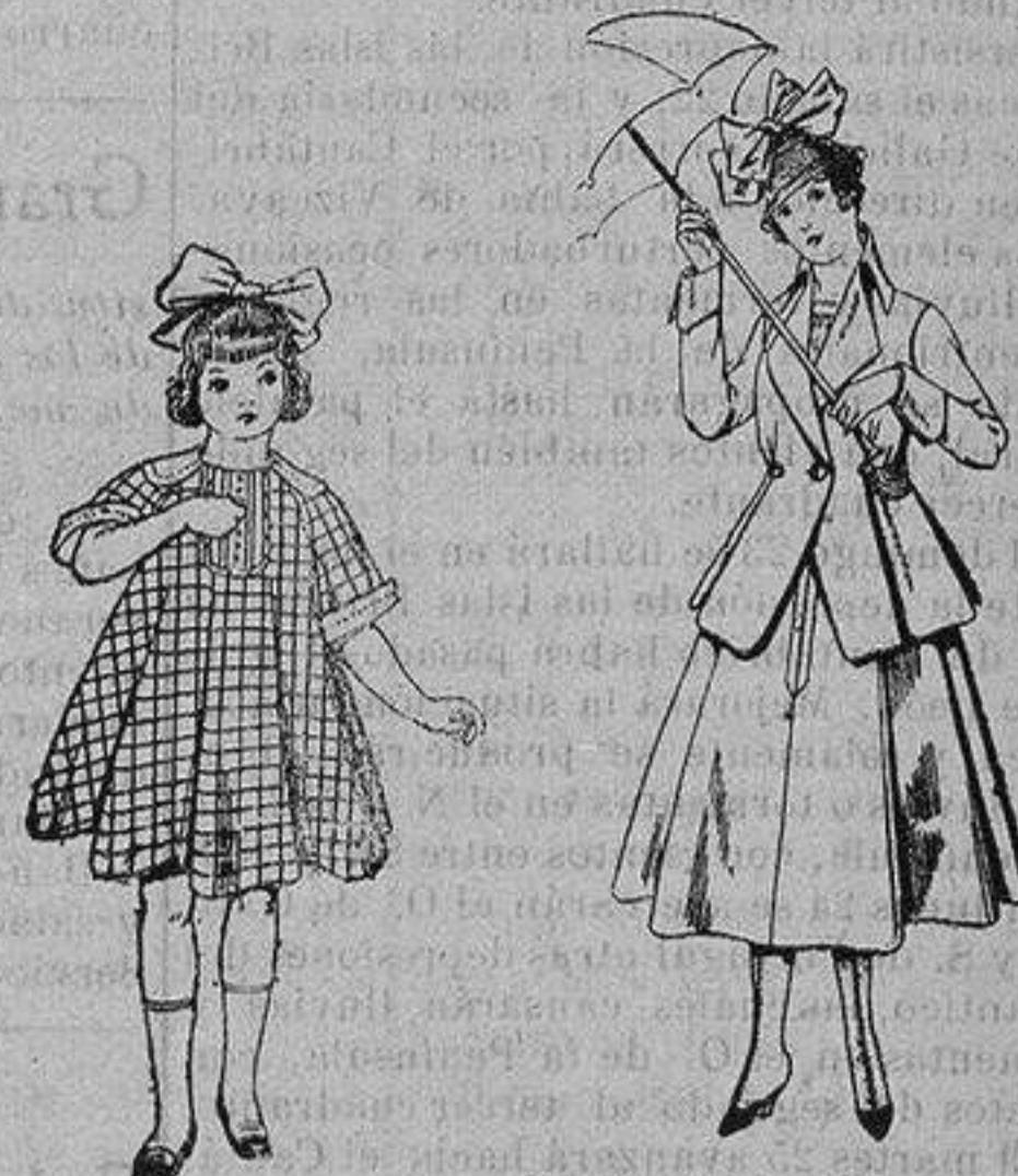
Trajes de lanilla para jovencitas de 13 a 16 años. Trajes de lanilla negra azul y color, para jovencitas de 13 a 16 años. De ptas. 50 a 55

Precio Fijo - Ventas al contado Pídase el Catálogo General